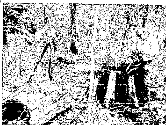
Fotografía 3, 4,5 y 6. Tala de árboles que se presenta en la Rivera del arroyo las delicias, que está afectando las comunidades de Tamaquito y arroyo hondo.