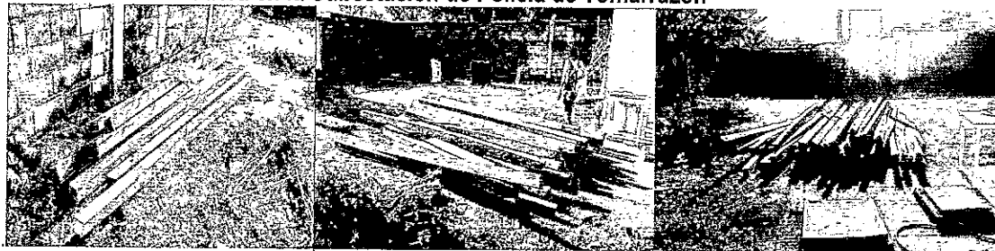
Madera en la Subestación de Policía de Tomarrazón

En total son: 70 piezas de la especie Perehuétano (Brosimum alicastrum) con medidas de 4m x 4" x 2" pulgadas, la incautación se registró en el acta 0235 de la policía nacional quienes hicieron la incautación del producto por no presentar permiso de la Autoridad Ambiental para su aprovechamiento y movilización, dejándola en su momento en la Subestación de Tomarrazón para el recibido legal por parte de la Autoridad Ambiental.