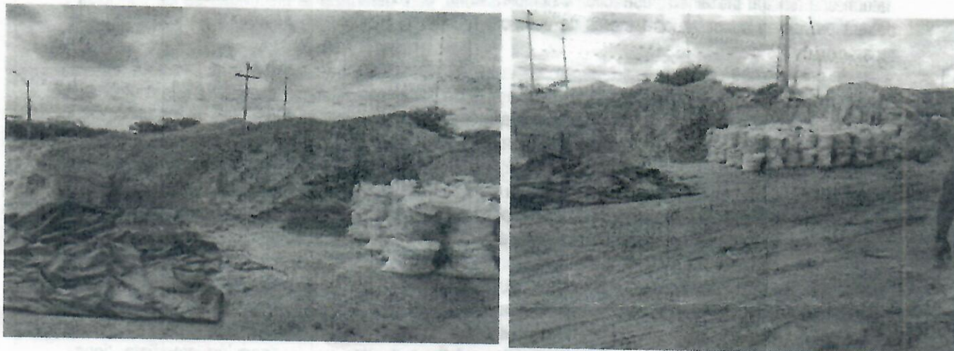
Fotografía 6 y 7 Disposición de sal por parte de la empresa Vida Sal.