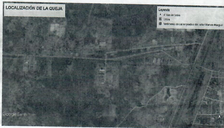
Figura 1. Localización geográfica de la queja