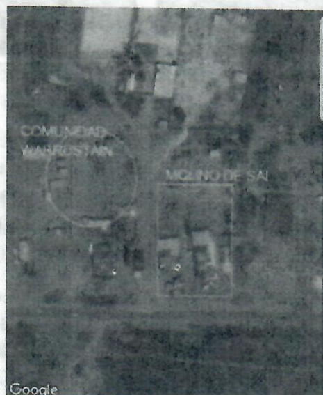
Fotografía 2 Zoom del área afectada

Esta disposición de sal se encuentra contigua a la empresa CABRALES PAFFEN S.A como se puede observar en la Fotografía 2