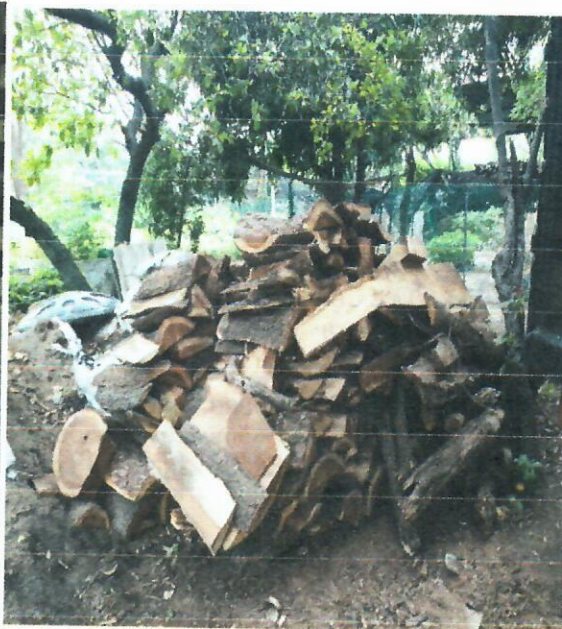
Fig. 3. Descargue de la materia prima Fig. 4. Total del Decomiso preventivo