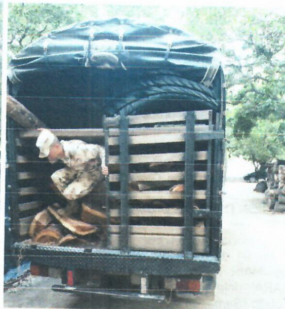
Fig. 1. Recepción de madera (orillos) Fig. 2. Puesto a disposición del decomiso