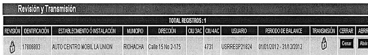
Imagen No 1. Reportes actualizados en el Registro de generadores por el establecimiento generador Autocentro Mobil LA UNION. Captura tomada del Registro de Generadores.

El establecimiento generador Autocentro Mobil LA UNION, NO realizó la actualización de la información requerida en el Registro de Generadores de Residuos o Desechos Peligrosos, para los periodos de balance 2013::2014::2015 y 2016. Dicha actualización debe ser realizada según lo establecido en la Resolución 1362 de 2007, a más tardar el 31 de marzo de cada año.