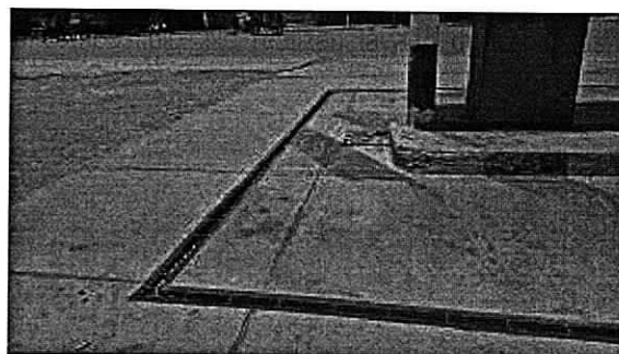
Fotografías No 1 – 3. E.D.S. El Porvenir.

Se reitera que el establecimiento EDS Automotriz El Porvenir, identificado con el Nit 5190237 – 9, se encuentra inscrito en el Registro de Generadores de Residuos o Desechos Peligrosos desde el 15 de mayo de 2013.