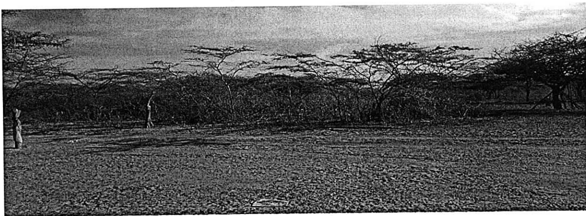
Fotografía 2. Cobertura vegetal

En los alrededores al punto donde se planea realizar el pozo, no se localiza actividad cercana diferente a las actividades cotidianas de la comunidad, y la cobertura vegetal es escasa, de especies menores entre rastros, arbustos, cactus, y árboles de poco tamaño como trupillo. (Ver Fotografía 2).