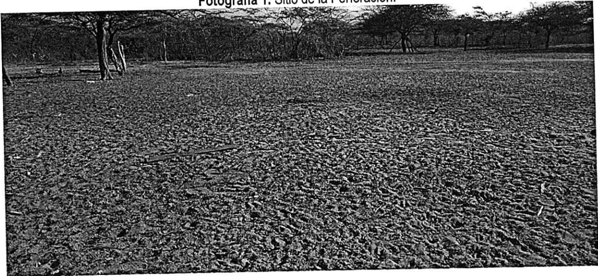
Fotografía 1. Sitio de la Perforación.

identificar las características de la zona donde se localizará el pozo: cuerpos de agua cercanos, presencia de otros aprovechamientos de agua subterránea, fuentes potenciales de contaminación y cobertura vegetal.