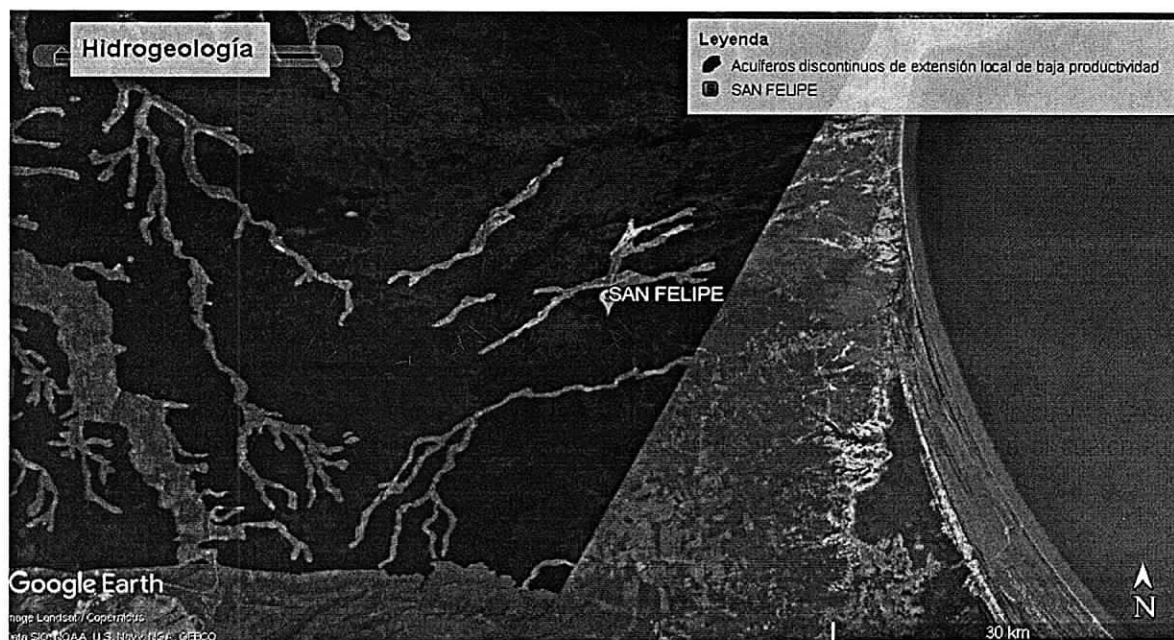
Figura 3. Hidrogeología

La condición geológica del área nos muestra que la comunidad se encuentra situada sobre la cuenca Cesar-Ranchería, predominando en el municipio las rocas sedimentarias desde el triásico hasta el cuaternario, observándose en los depósitos actuales del río Ranchería.