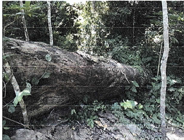
Fig. 2. Árbol 1. De Caracolí