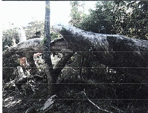
Fig. 3. Árbol Caído