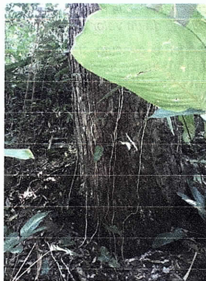
Fig. 7. Individuo Arboreo Muerto