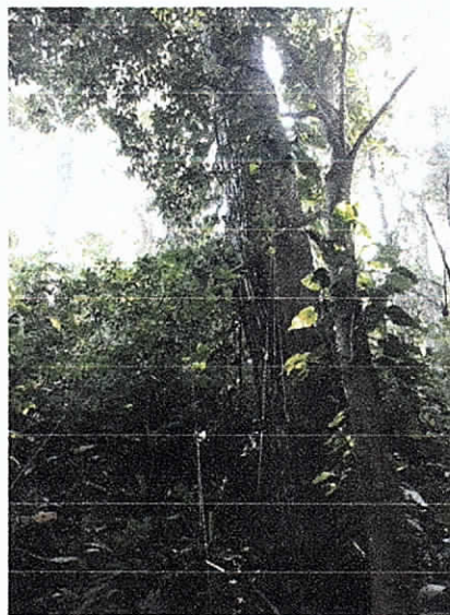
Fig.9. Muerto en pie