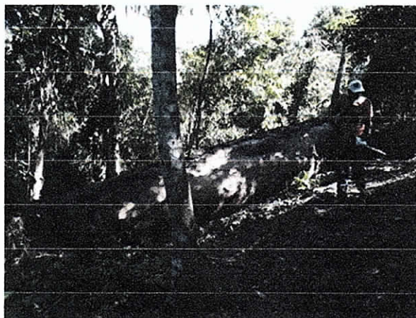
Fig. 4. Individuo arboreo de Caracolí