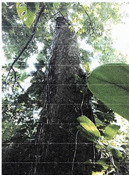
Fig. 8. Altura próxima de 15 m