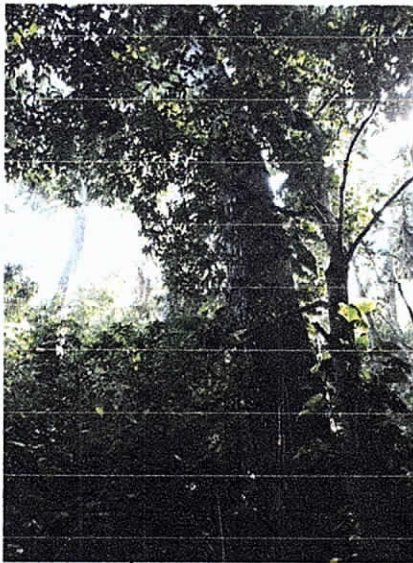
Fig. 6. Árbol 2 de la especie Caracolí