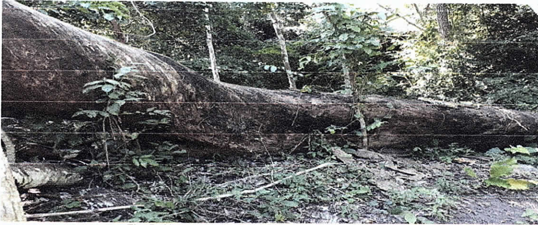
Fig. 5. Altura comercial de 7,70 metros

Posteriormente procedimos a llegar al punto donde se encuentra el segundo árbol de Caracolí, este se encuentra muerto en pie, según el señor Regulo este árbol lleva muerto ya hace varios años. Se tomaron las medidas dasométricas arrojando un DAP de 1,31 metros (m), una altura próxima de 15 metros (m) y un volumen total de biomasa de 14,152 metros cúbicos (m 3 ).