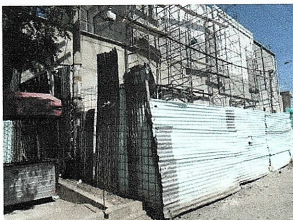
Iglesia en construcción (enero 08 de 2018)