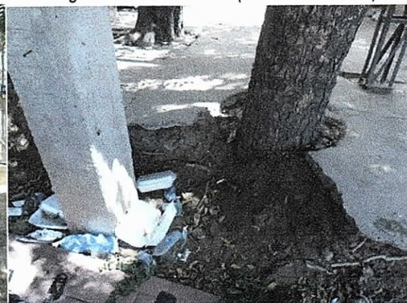
Muros de construcción junto a los árboles de Neem (enero 08 de 2018)