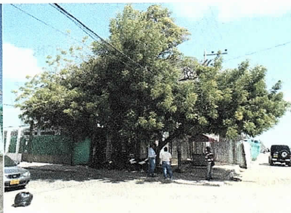
Vista general de los arboles (enero 08 de 2018)