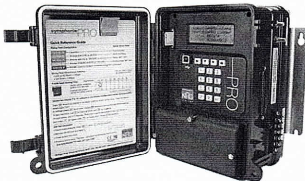
Ilustración 1. SymphoniePRO de NRG

Sistema de alimentación: Formado por placa solar Symphonie de 15 kW y batería de reserva dentro de la caja donde va el logger. La placa solar se ubica aprox. a 30 metros de altura y la caja del logger a 20 metros.