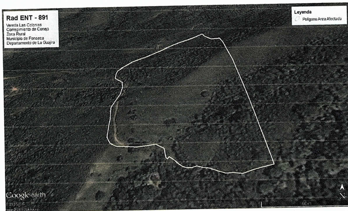
Fig.1. Ubicación satelital de la zona de Afectada.