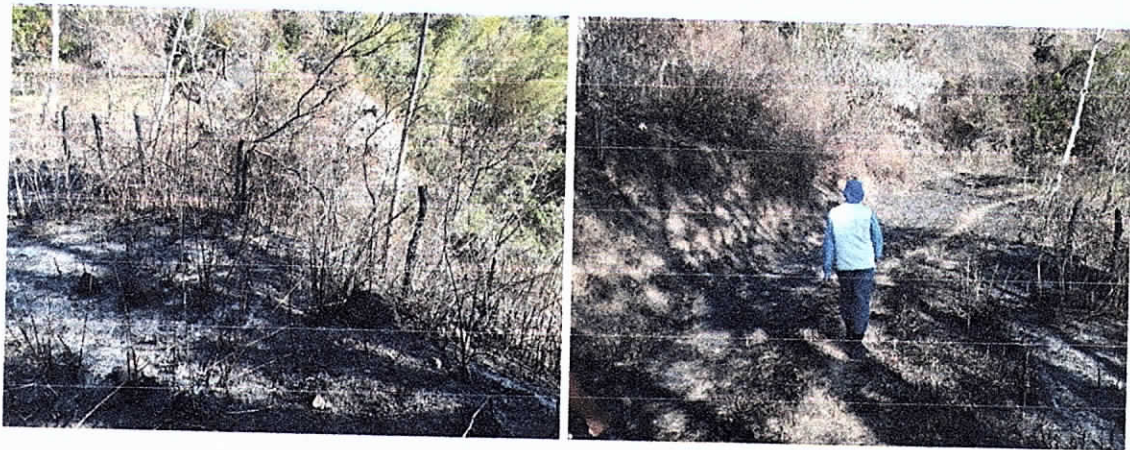
Fig. (6-7). Área aproximada de 5,33 ha