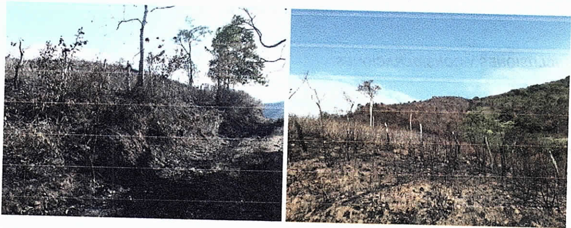
Fig. (4-5). Vegetación en estrato de brinzal y latizal