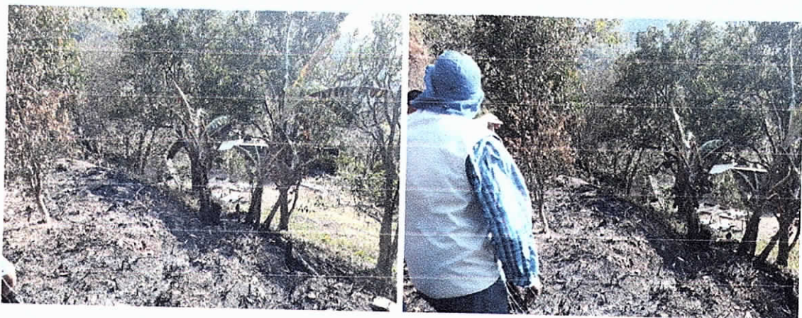
Fig. (8-9) vegetación de presente en el predio La Gota