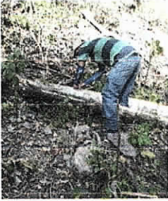
Arboles 5 y 6