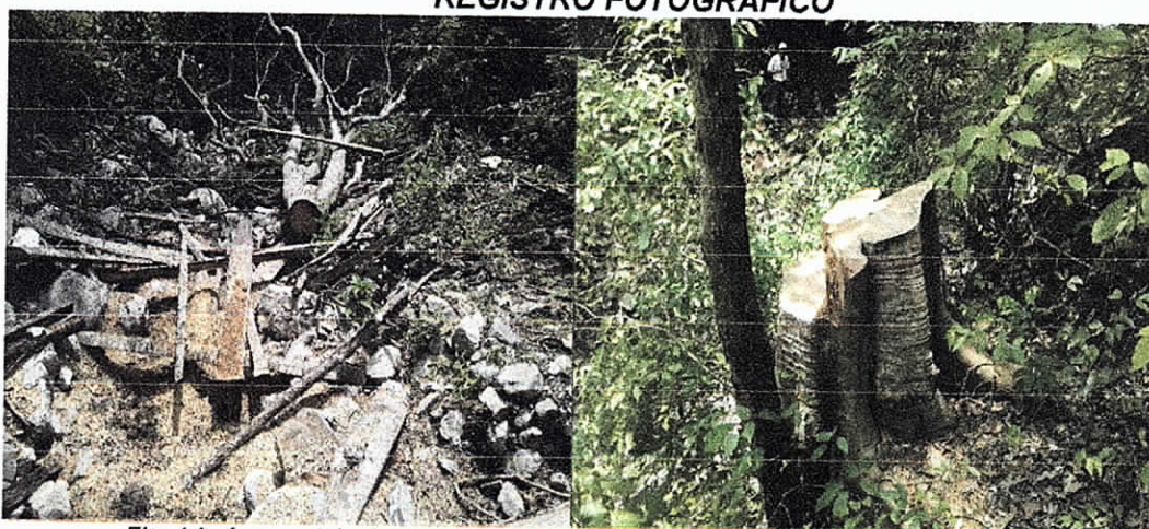
Fig. 1 Imágenes tala de individuo arbóreo de la especie Guáimaro ( Brosimum alicastrum )