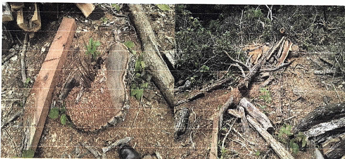
Fig. 3. Se evidencia tocón Individuo Arbóreo de la especie Corazón Fino ( Plalymiscium hebestachyum )