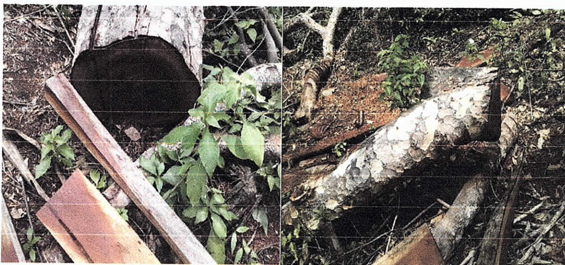
Fig. 4 Tala de individuo arbóreo de la especie Pereguetano en área del predio California