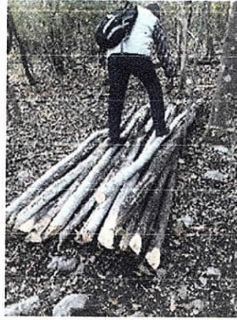
Fig. (4 – 5). Punto de tala y acopio de madera de diversas especies