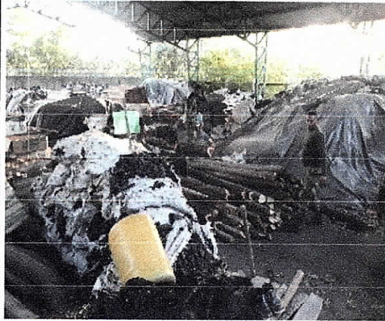
Fig. (6 – 7). Descarga del decomiso en el angar de la Direccion Territorial Sur