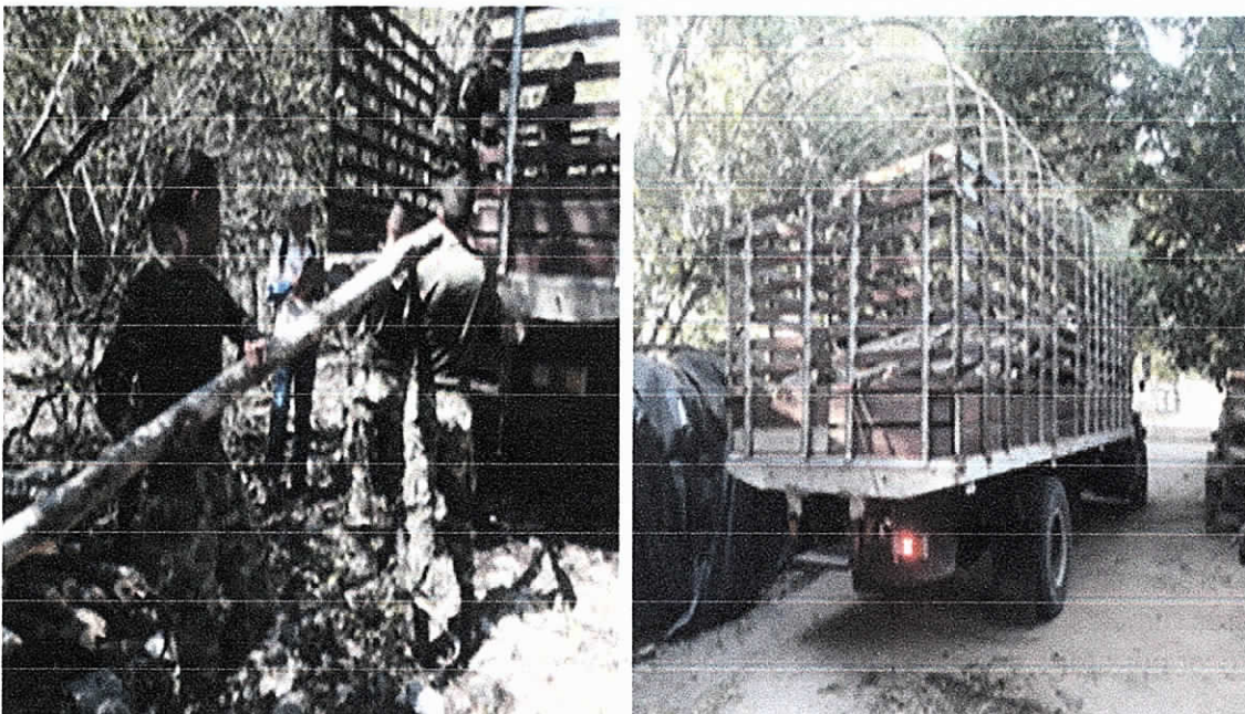
Fig. (2-3). Madera decomisada del 04/01/2019