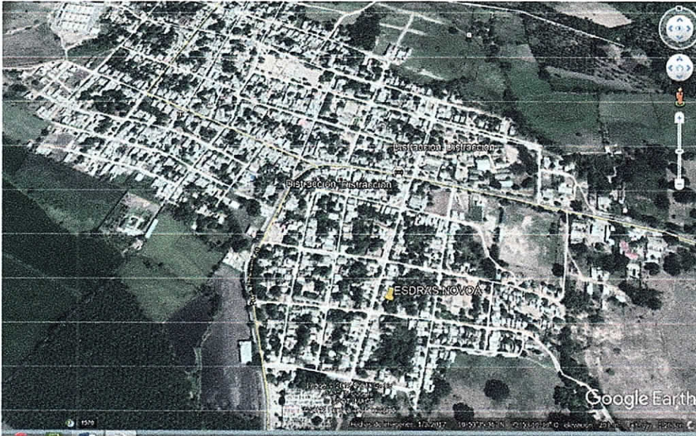
Fig. 2. Ubicación de árboles al interior de predio.