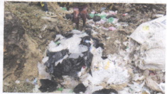
Foto No 11, 12 y 13. Residuos de empresa empackadora de sal de Uribí dispuesto inadecuadamente en el lugar donde operaba la estación de transferencia de residuos y al lado de la celda clausurada. 12 de diciembre de 2018.

Si bien no se pudo detectar la empresa que contrata vehículos para que la disposición clandestina de sus residuos, si es posible iniciar una investigación contra persona indeterminada propietaria del vehículo plenamente identificado cuya información debe reposar en el tránsito de Riohacha.