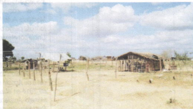
Foto No 1, 2 y 3. Fecha: 12 de diciembre de 2018. Botadero a cielo abierto clausurado de Uribí. Asentamiento de comunidades

Esta situación se considera preocupante debido a que vivir en cercanía a un relleno sanitario puede generar riesgos asociados a enfermedades como el asma, la incidencia de leucemia y cáncer en distintos órganos del cuerpo como vejiga, pulmón y riñón, estomago, entre otros. Los fetos y niños recién nacidos son los más vulnerables presentando anomalías congénitas y riesgo de malformaciones, señala la literatura consultada al respecto.