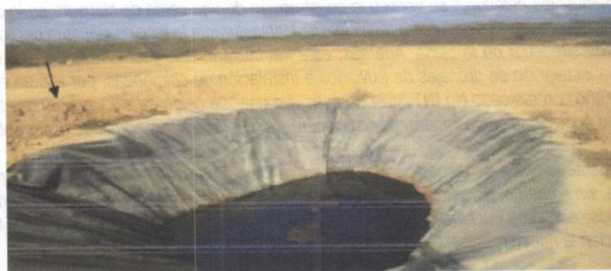
Foto No 4. Fecha: 20 de enero de 2017. Laguna de lixiviados. (Uribí)

El sistema de manejo de lixiviados el cual consiste en una laguna debidamente impermeabilizada fue construido con el propósito de evitar la filtración de estos al suelo. La siguiente imagen evidencia el estado de la laguna en el año 2017: