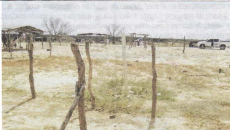
Foto No 7. Fecha: 12 de diciembre de 2018. Botadero a cielo abierto clausurado de Uribia. Chimeneas de gases.