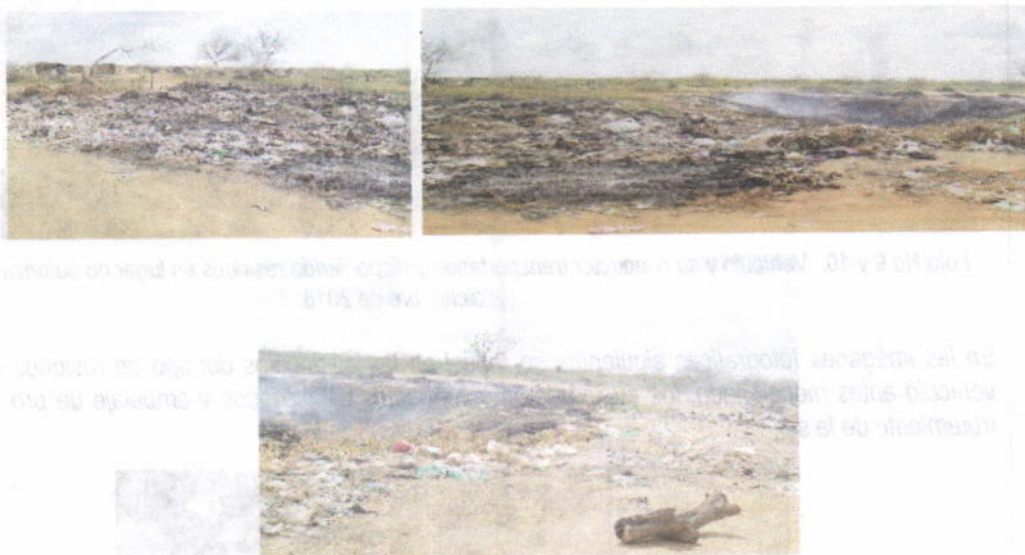
Foto No 14, 15 y 16. Lugar de disposición y quema permanente de residuos. Donde operaba la estación de transferencia de residuos del municipio de Uribí. Fecha. 12 de diciembre de 2018.

A continuación se muestra el lugar donde se dispone y quema permanente los residuos provenientes de empresa salera y otros que disponen en el lugar y que son quemadas en forma inmediata por recicladores, que recuperan lo que tiene valor comercial, y el resto lo queman.