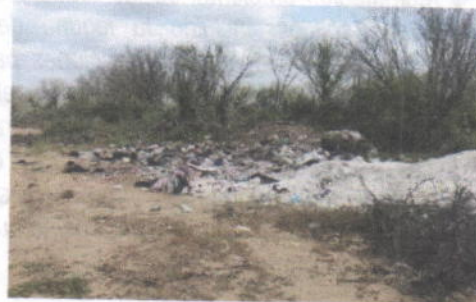
Foto No 25, 26, 27 y 28. Fecha: 12 de diciembre de 2018. Botadero a cielo abierto clausurado de Uribia. Puntos críticos en vía de acceso.