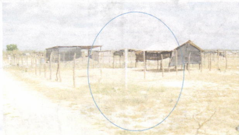
Foto No 8. Fecha: 12 de diciembre de 2018. Botadero a cielo abierto clausurado de Uribia. Chimeneas de gases.

Las imágenes fotográficas anteriores son un indicativo que las viviendas están localizadas encima de la celda clausurada con los riesgos ya enunciados.