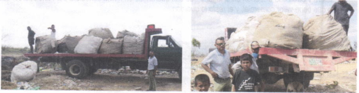
Foto No 9 y 10. Vehículo y su conductor transportando y disponiendo residuos en lugar no autorizado en Uribí. 12 de diciembre de 2018.

En las imágenes fotográficas siguientes se muestran las evidencias del tipo de residuos que transportaba el vehículo antes mencionado, los cuales están compuestos de plásticos y embalaje de productos usados en el tratamiento de la sal.