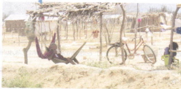
Foto No 5 (ampliada). 12 de diciembre de 2018. Laguna de lixiviados. (Uribí)

Se cumplió con la construcción del sistema de manejo de lixiviados mas no con su conservación y mantenimiento.