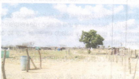
Fotos No 19, 20, 21 y 22. Botadero clausurado año 2009. Se aprecia portón de acceso, cimiento del cerramiento y vestigio de algunos árboles de la restauración ambiental. Actualmente todo cubierto de viviendas producto de la invasión de personas, la mayoría de origen venezolano.