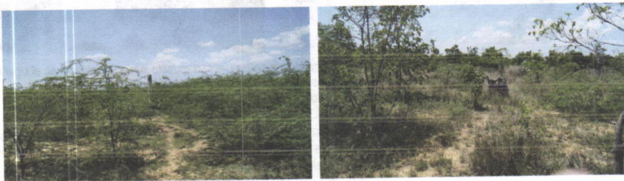
Foto No 17 y 18. Botadero clausurado Uribí año 2009. Seguimiento a septiembre 6 de 2011. Se aprecia al fondo el portón de acceso (foto 19) y chimeneas construidas (foto 20). En ambas el desarrollo de la vegetación de la restauración.

Además de la invasión con viviendas en la actual celda clausurada recientemente, la invasión se efectuó también en áreas aledañas y en el botadero clausurado en el año 2009, donde se confinó los residuos en una celda, se hizo cerramiento en concreto y malla eslabonada, con chimeneas y restauración ambiental. En las fotografías que se presentan a continuación se muestra la celda clausurada en el año 2009 y en estado actual.