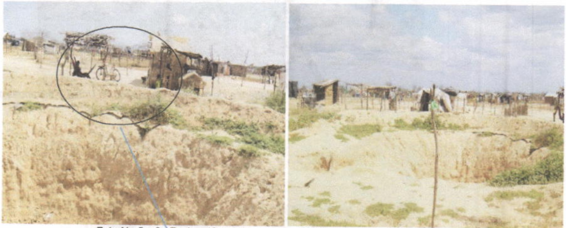
Foto No 5 y 6. Fecha: 12 de diciembre de 2018. Laguna de lixiviados. (Uribí)

Durante la visita realizada en el mes de julio de 2018 se evidenció el robo de la geomembrana de la laguna de lixiviados. A partir de entonces y hasta la fecha de la visita de seguimiento realizada el 12 de diciembre de 2018, no se han realizado correcciones para impermeabilizarla y recuperar su estado original. Aunque la tasa de generación de lixiviados es baja y el déficit hídrico es muy alto en Uribí. La ausencia de la geomembrana en la laguna de lixiviados genera impactos negativos debido a la infiltración de estos directamente al suelo. A continuación, se observa el estado actual de la laguna: