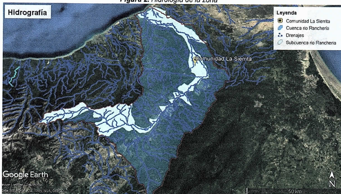
Figura 2. Hidrología de la zona

El punto de perforación se localiza sobre la Cuenca Rio Ranchería, en la subcuenca Rio Ranchería (ver figura 2). Relativamente cerca al punto de perforación proyectado (a 200 m aproximadamente) se encuentran fuentes hídricas superficiales intermitentes como el arroyo La Sierrita y algunos Jaweyes.