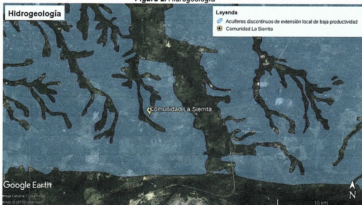
Figura 2. Hidrogeología