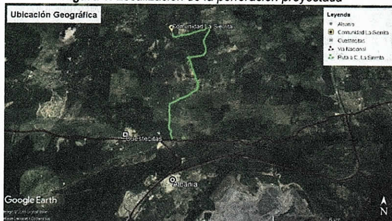
Figura 1. Localización de la perforación proyectada

El área objeto de la solicitud se localiza en la comunidad indígena de La Sierrita II, la misma está situada en zona rural del municipio de Albania, se recorren aproximadamente 4 km en carretera destapada desde el punto ubicado sobre el km 2, margen derecha de la vía que de Albania Conduce a Cuestecitas. El punto donde se proyecta realizar la perforación se localiza en las coordenadas mostradas en la Tabla 1 y en el punto indicado en la Figura 1.