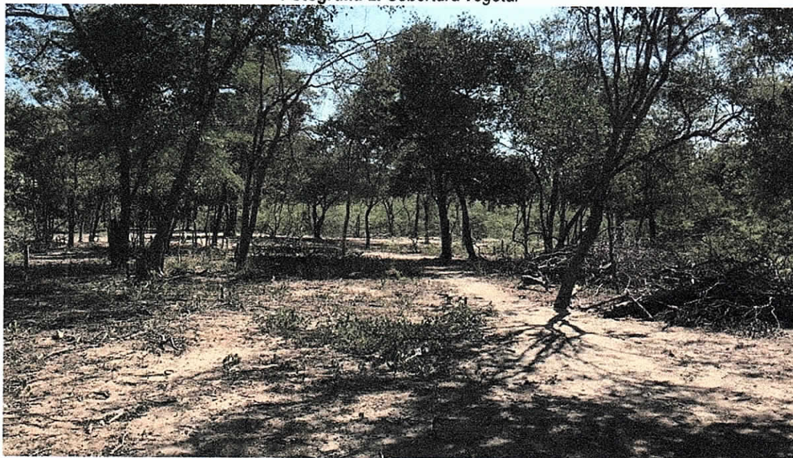
Fotografía 2. Cobertura vegetal

En los alrededores al punto donde se planea realizar el pozo, no se localiza actividad cercana diferente a las actividades cotidianas de la comunidad, en general la cobertura vegetal es escasa, de especies menores entre rastrojos, arbustos, cactus, y árboles de poco tamaño como trupillo. Sin embargo en menor cantidad se pudieron observar especies como Guasimo y Algarrobito (Ver Fotografía 2).