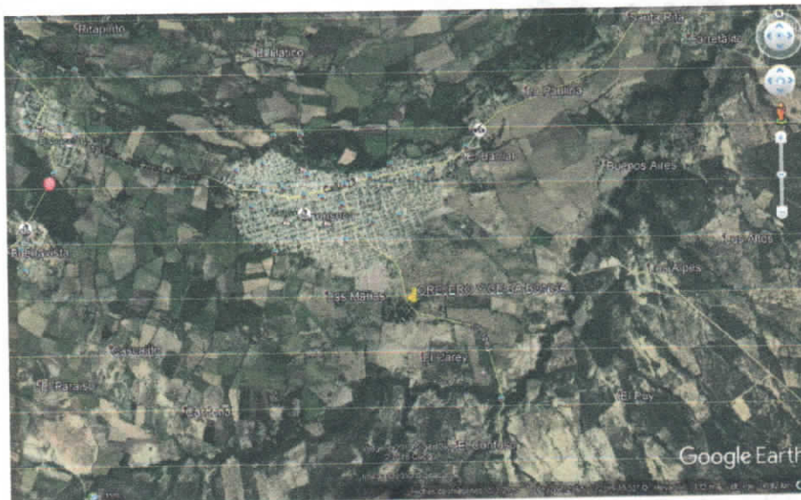
Fig. 1. Ubicación satelital del sitio y ruta de acceso.