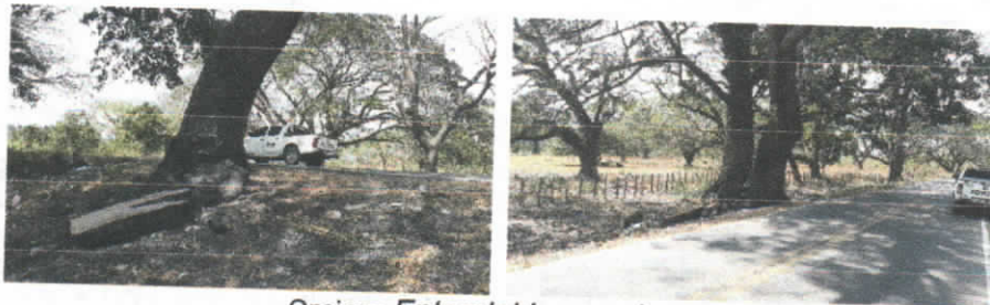
Orejero Enterolobium cyclocarpum