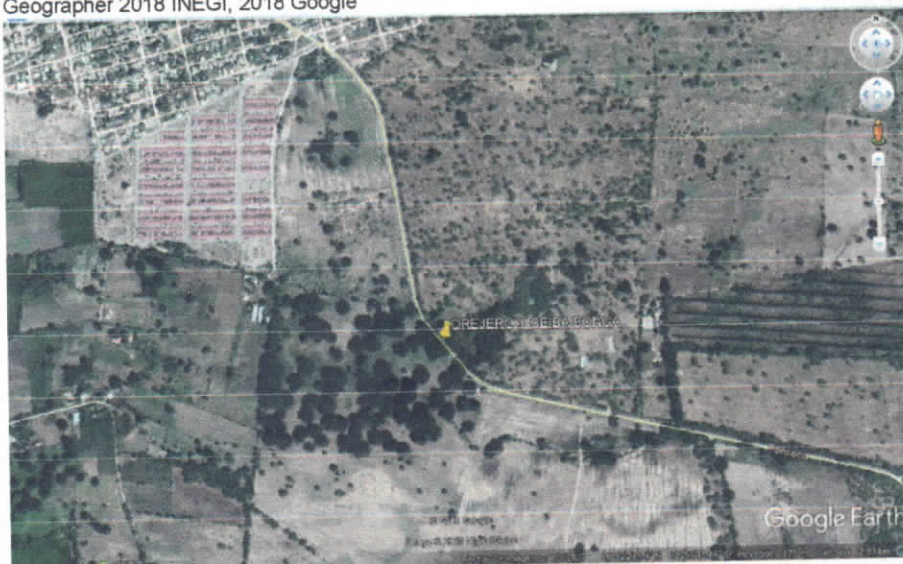
Fig. 2. Ubicación de árboles .