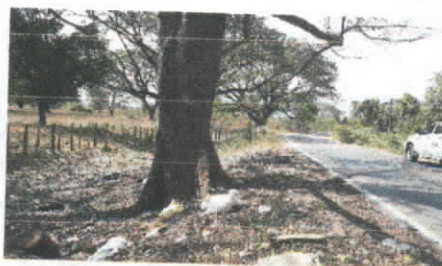
Ceiba pentandra Ceiba pentandra