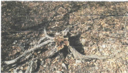
Árbol corazón fino talado