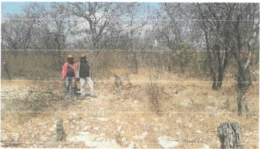
Aclareo del bosque por la tala