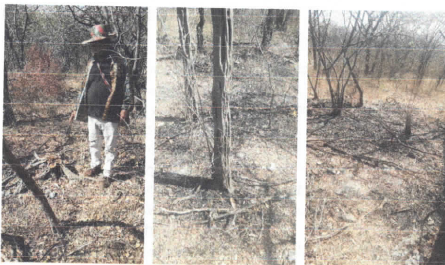
Árbol talado y quemas alrededor de algunos arboles