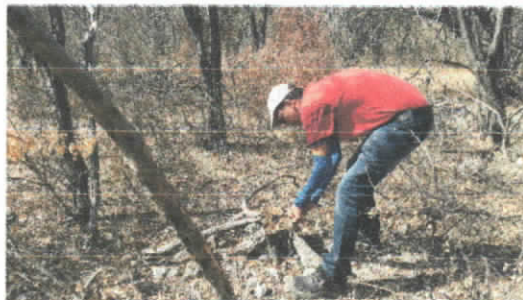
Medición del diámetro a nivel de tocón