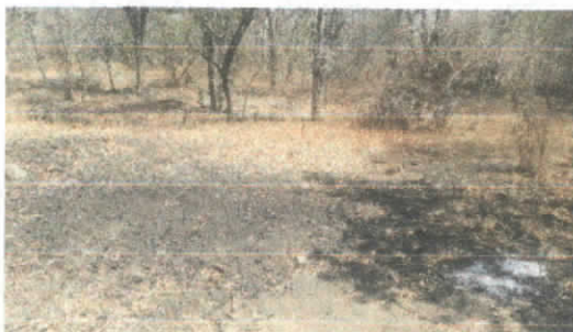
Evidencia de elaboración de carbón