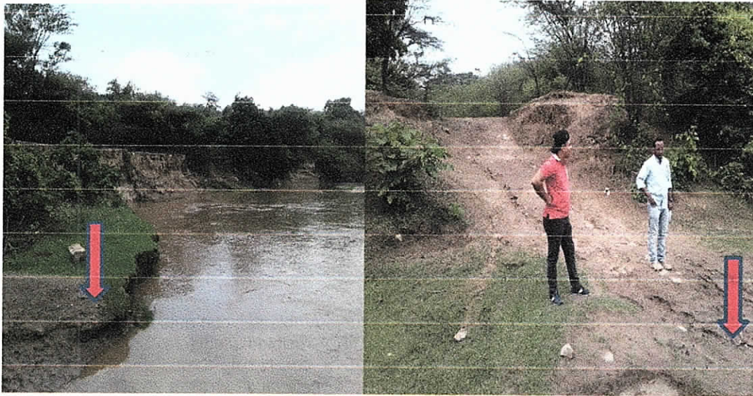
Fig. 1. Zona de Cargue Extracción de Material de Arrastre (Arena).