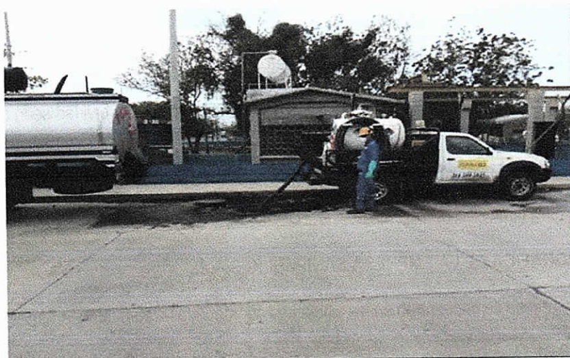
Foto 2: Punto de vertimiento de la empresa SANIPUBLIC S.A.S. – Riohacha La Guajira (Avenida Circunvalar)