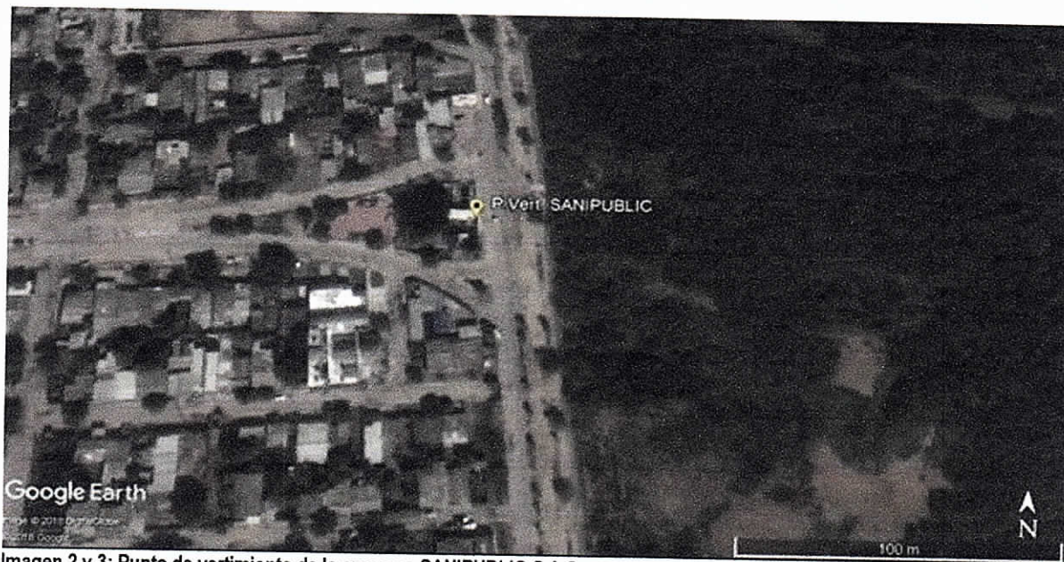
Imagen 2 y 3: Punto de vertimiento de la empresa SANIPUBLIC S.A.S.