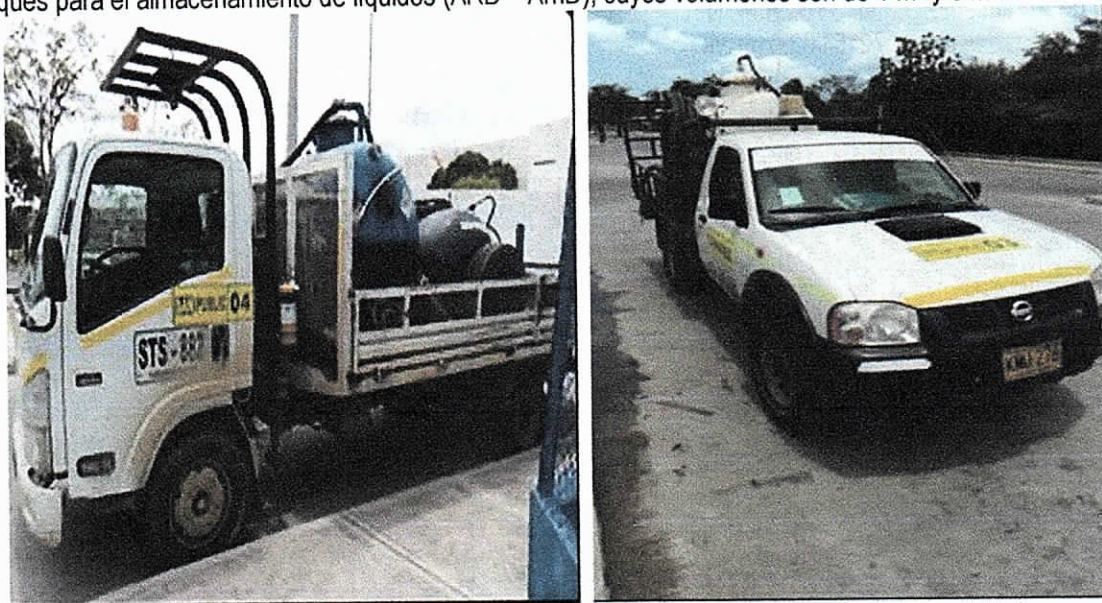
Foto 3 y 4: Vehículos utilizados por la empresa SANIPUBLIC S.A.S., en la realización de sus actividades

Los vehículos utilizados por SANIPUBLIC S.A.S., para la realización de sus actividades están adecuados con tanques para el almacenamiento de líquidos (ARD – ArnD), cuyos volúmenes son de 1 m 3 y 3 m 3 .