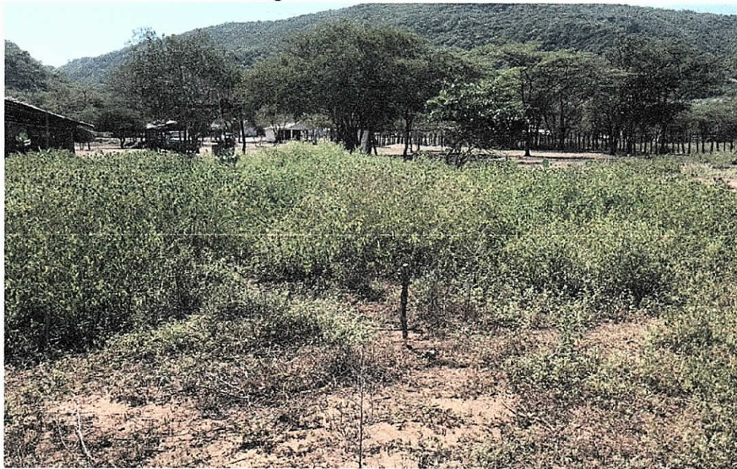
Fotografía 1. Sitio de la Perforación.

El 11 de diciembre del 2018 se realizó la visita de evaluación ambiental a la comunidad indígena de Loma Fresca, ubicada en zona rural del municipio de Albania, la visita se adelantó con el acompañamiento de la señora Rafaelina Cambar Cambar, miembro de la comunidad. En campo se procedió a localizar las coordenadas del punto indicado en el formulario de solicitud de permiso de prospección y exploración de aguas subterráneas (Ver Fotografía 1 y Figura 1). De igual manera, se realizó un recorrido con el fin de identificar las características de la zona donde se localizará el pozo: cuerpos de agua cercanos, presencia de otros aprovechamientos de agua subterránea, fuentes potenciales de contaminación y cobertura vegetal.