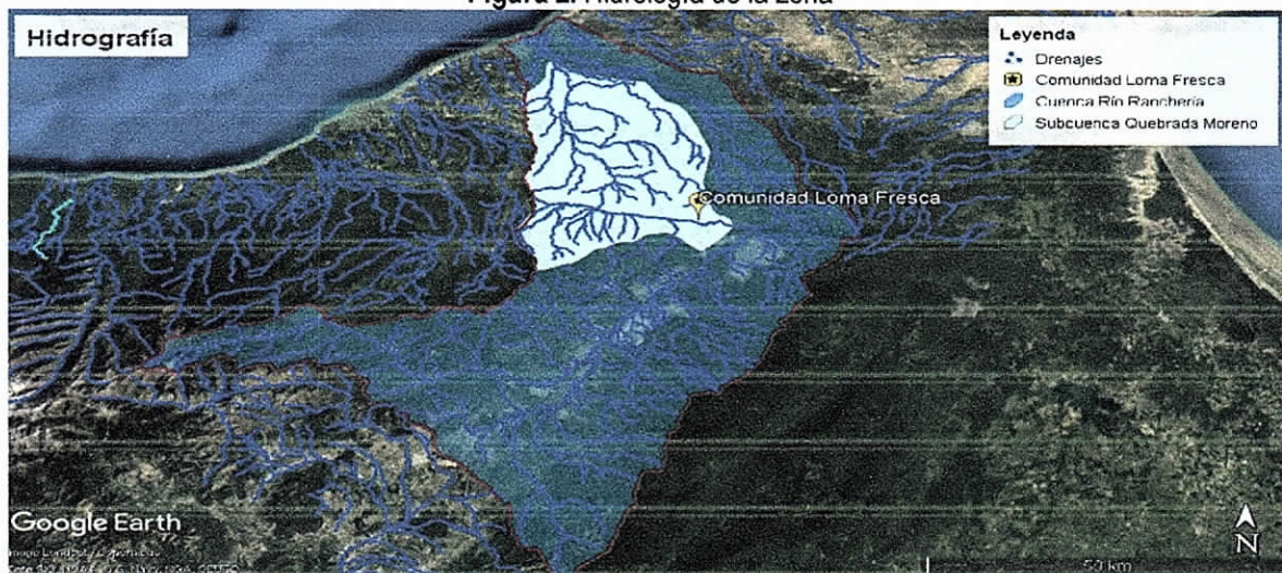
Figura 2. Hidrología de la zona

El punto de perforación se localiza sobre la Cuenca Río Ranchería, en la subcuenca Quebrada Moreno (ver figura 2). Relativamente cerca al punto de perforación proyectado (a 200 m aproximadamente) se encuentran fuentes hídricas superficiales intermitentes como el arroyo El salado y algunos Jaweyes.