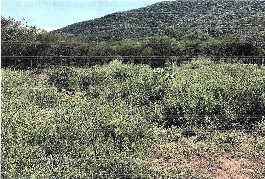
Fotografía 2. Cobertura vegetal