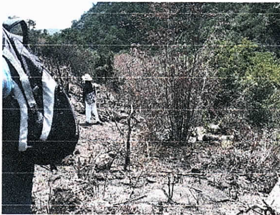
Fig.3. Área intervenida