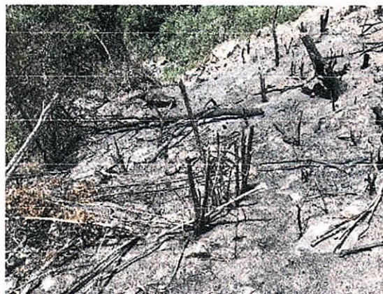
Fig.7. Área intervenida de Un cuarto de Hectárea zona afectada