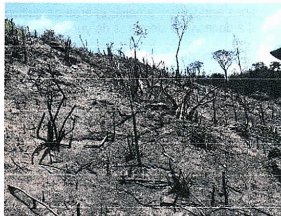
Fig.4. Evidencia de Zocola realizada