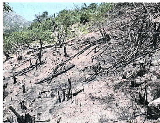
Fig.8. Vegetación de rastrojo bajo en la zona afectada