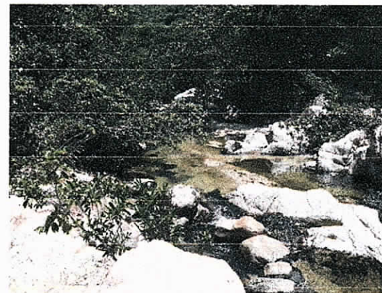
Fig.6. Vista del Rio Cesar desde la Zocola