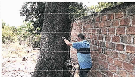
Afectación de un árbol