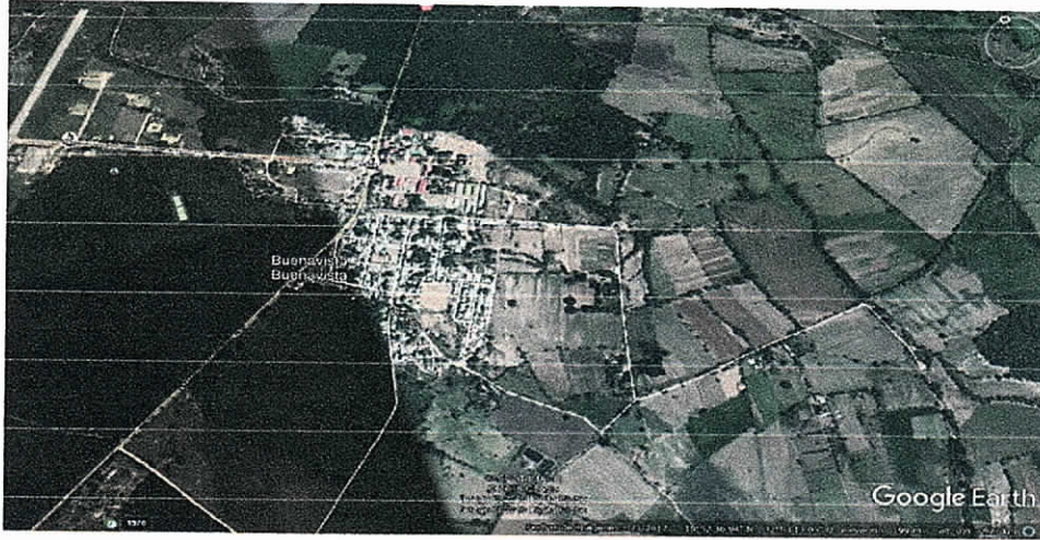
Fig. 1. Ubicación satelital del sitio y ruta de acceso.