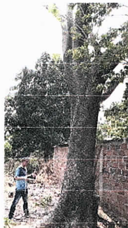
Medición del diámetro de los arboles