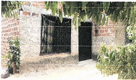
Predio donde se ubica los arboles