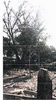
Arbol muerte descendente