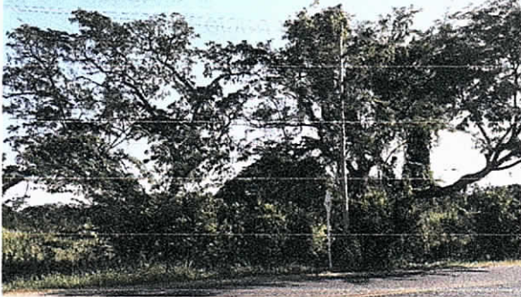
Inclinación de los arboles