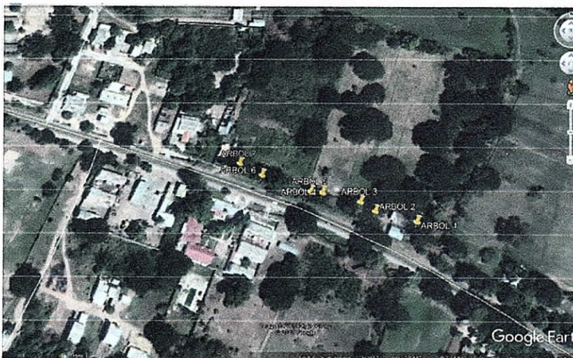
Fig. 2. Ubicación de árboles al interior predio corral de Piedra.