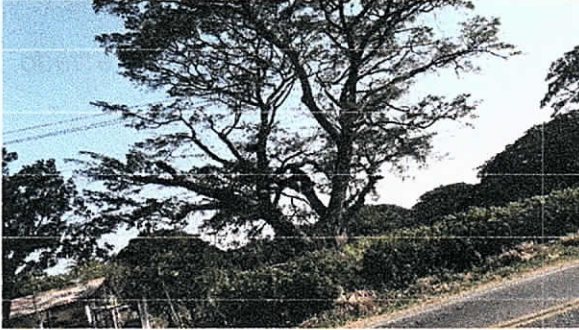
Arbol con respecto a casa y redes