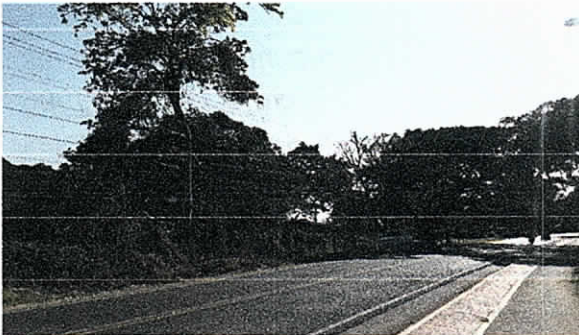
Arbol de Piñón