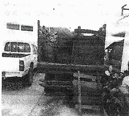
Foto 1. Carbón y vehículo en Corpoguajira