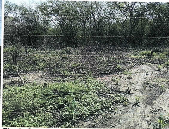
Fig. 3. Socola realizada para cultivo de maíz