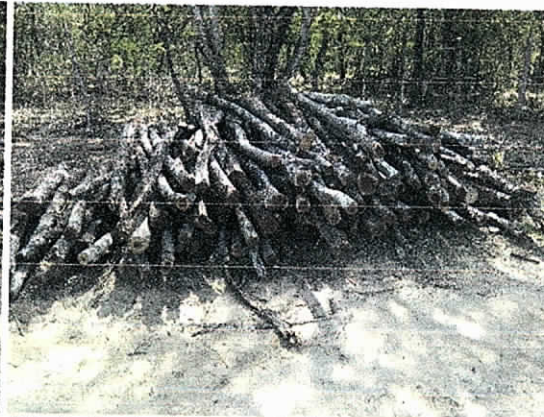
Fig. 5. Punto N° 2 acopio (60 puntales)