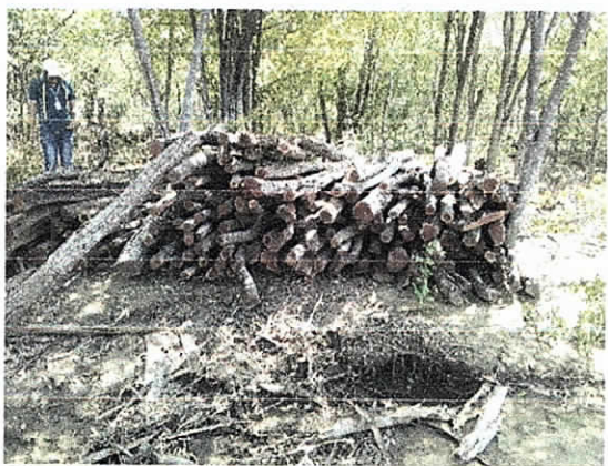
Fig. 8. Punto N° 5 acopio (170 puntales)