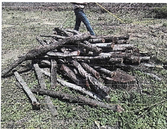
Fig. 6. Punto N° 3 acopio (30 puntales)