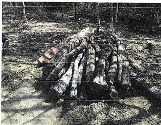
Fig. 7. Punto N° 4 acopio (19 puntales)