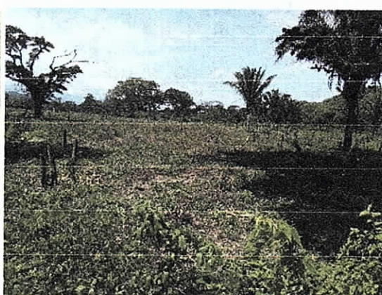
Fig. 9. Área socolada N° 2 (2-3 Has).