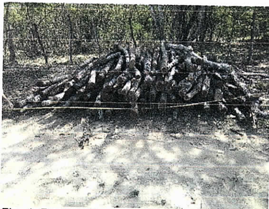
Fig. 4. Punto N°1 acopio (120 puntales)