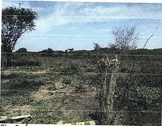
Fig. 2. Área socolada N° 1 (4 Has)