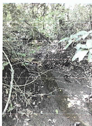
Fig. 10. Manantial Magalote, sin intervención.