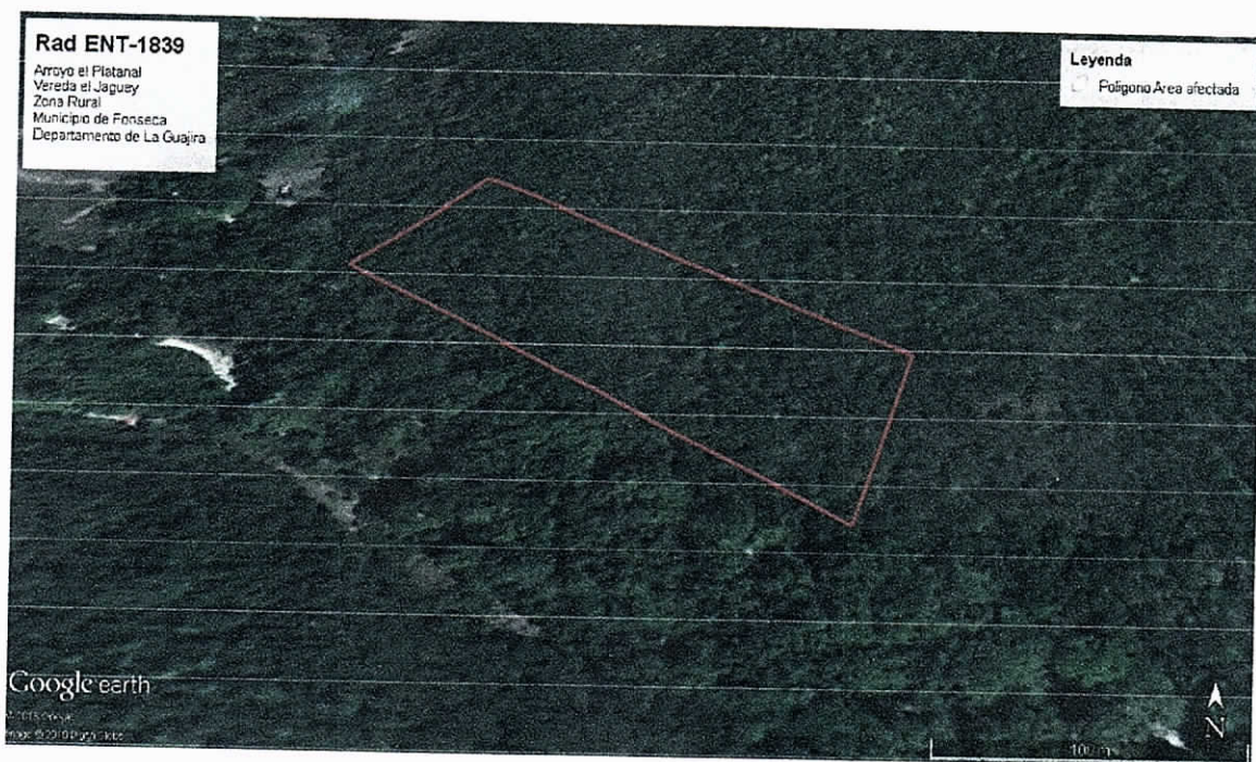
Fig. 2. Ubicación satelital del área afectado.