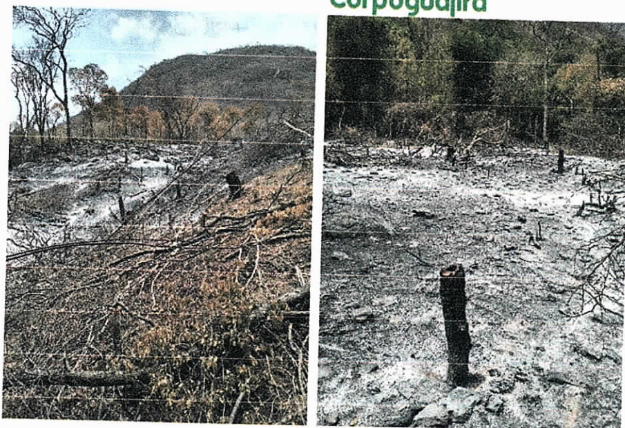
Fig. (10 – 11). Tala raza y trabajo de zocola