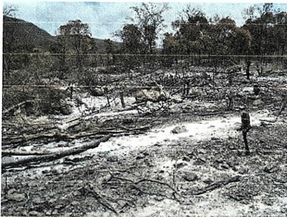
Fig. 9. Vestigios de la zocola