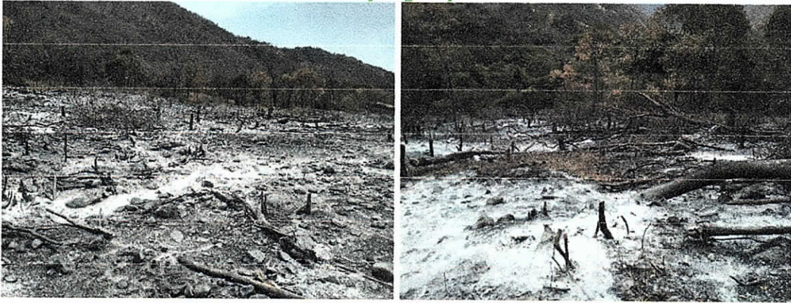
Fig. (3 – 4). Vegetación en estrato fustal