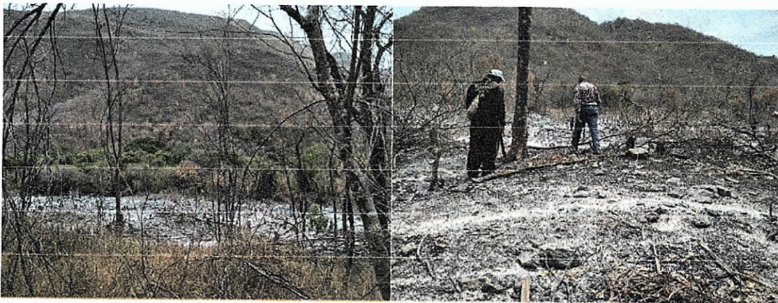
Fig. (7 – 8). Área de 2,79 ha