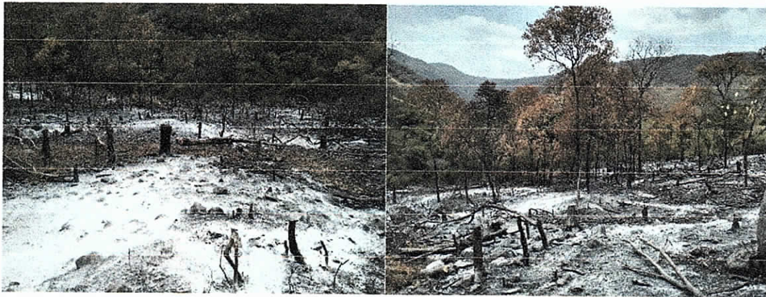
Fig. (5 – 6). Diversidad biológica afectada