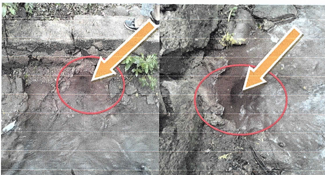
Fig. 3 imágenes de entrada de ducto de desagüe a cuerpo de agua Acequia "El Espinal"