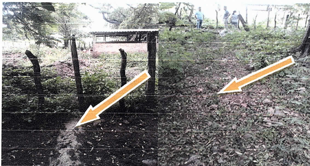
Sistema de tubería o ducto por donde se descarga vertimiento de aguas residuales a la acequia el espinal