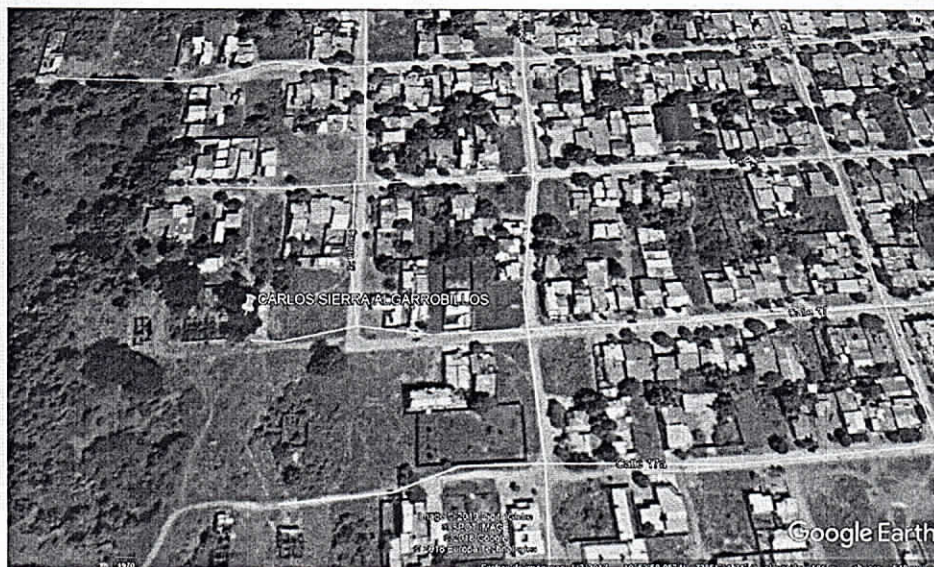
Fig. 2. Ubicación de los árboles .Fuente: US Dept of State Geographer 2018 INEGI, 2018 Google