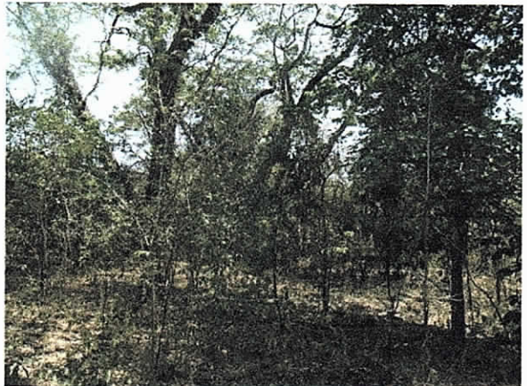
Foto 6, cobertura del río ranchería por donde saldrá la tubería a través de perforación dirigida