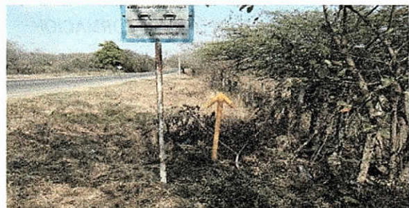
Foto 2, sector donde inicia el proyecto