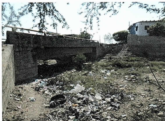
Foto 11. Cruce de la tubería sobre el arroyo Parrantial en el municipio de Maicao con perforación dirigida