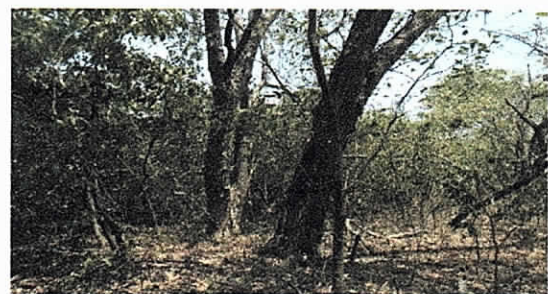
Foto 10, Cobertura del arroyo Bruno por donde pasara la tubería del gasoducto de la empresa Gases de La Guajira