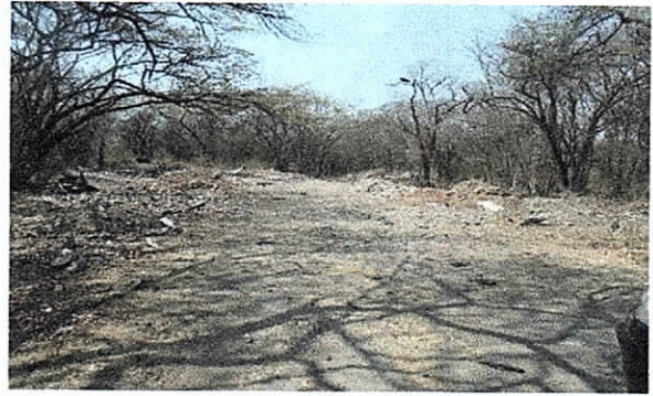
Foto 4, acceso para llegar al río ranchería