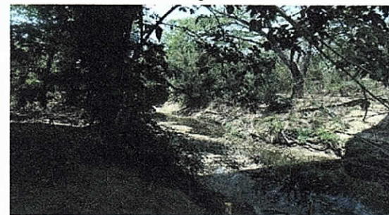
Foto 9, Cobertura del Arroyo Bruno