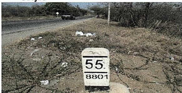
Foto 1, sitio donde inicia el tramo del proyecto