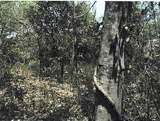
Foto 7, Cobertura sobre el río ranchería por donde saldrá la tubería del gasoducto con perforación dirigida