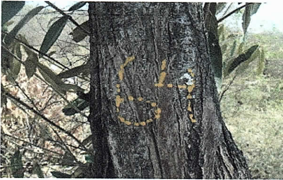
Foto 3 Evidencia de inventario forestal