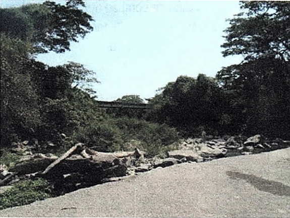
Foto 5, batea y cobertura por donde atravesara el tubo con perforación dirigida