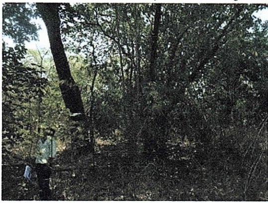
Foto 8, Cobertura del río Ranchería por donde pasara la tubería antes de salir nuevamente a la vía