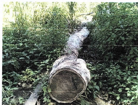
Fig. 3. Individuo arbóreo afectado