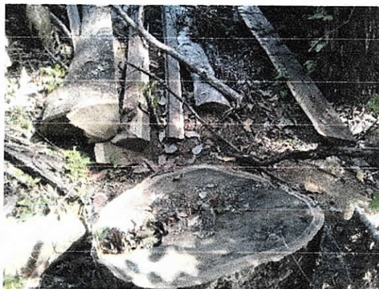
Fig. 2. Evidencia de Rechazo de madera de Guayacán