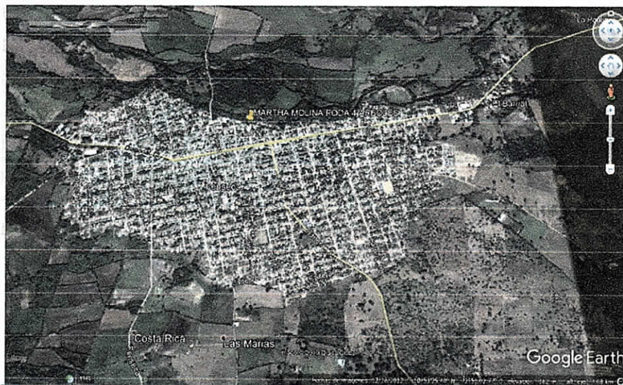
Fig.1. Ubicación satelital del sitio y ruta de acceso.