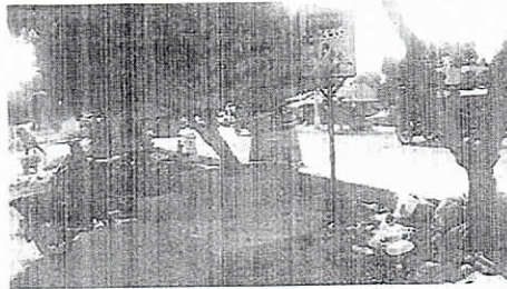
Calle 13 entre Carrera 15 y 16