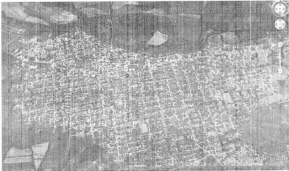
Fig. 1. Ubicación satelital del sitio y ruta de acceso.