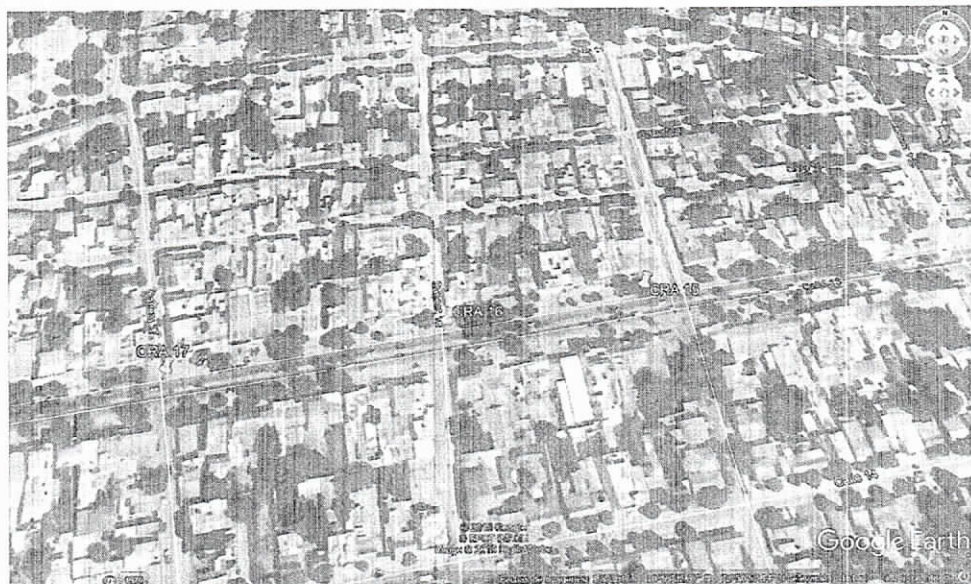
Fig. 2. Ubicación de los árboles