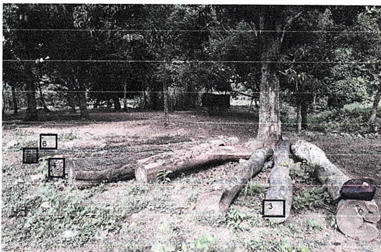
Trozas números 3, 4, 5 y 6

Para este caso no se aplica compensación forestal y tasa forestal ya que son trozas que fueron obtenidas hace más de 10 años.