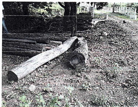
Ubicación de las trozas