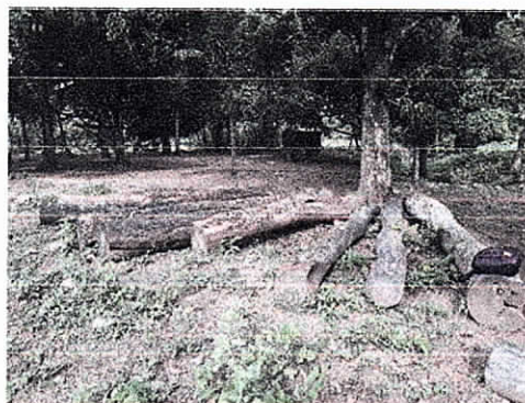
Ubicación de las trozas