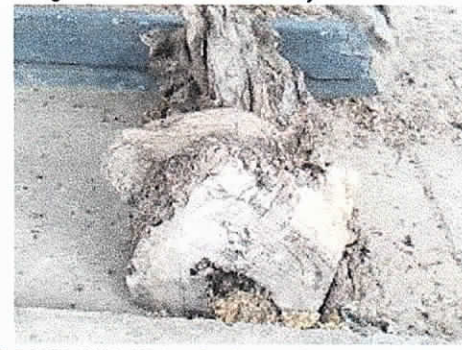
COMFAGUAJIRA – EURERE, Costado Nororiental Distrito de Riohacha. 04/02/2019