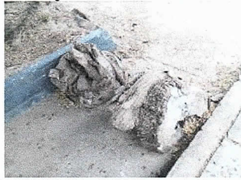
COMFAGUAJIRA – EURERE, Costado Nororiental Distrito de Riohacha. 04/02/2019