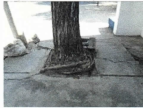
COMFAGUAJIRA – EURERE, Costado Sur Oriental Distrito de Riohacha. 04/02/2019