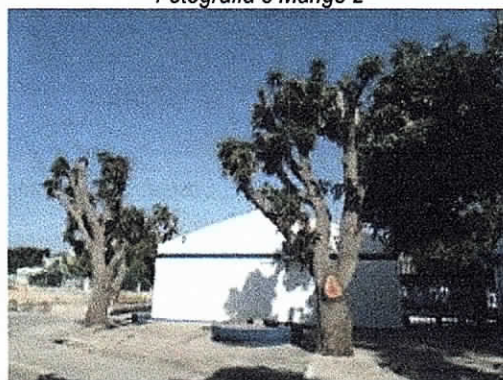
Fotografía 3 Mango 2

COMFAGUAJIRA – EURERE, Costado Occidental Distrito de Riohacha. 04/02/2019