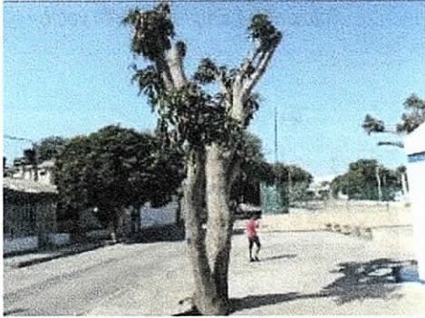
COMFAGUAJIRA – EURERE, Costado Occidental Distrito de Riohacha. 04/02/2019