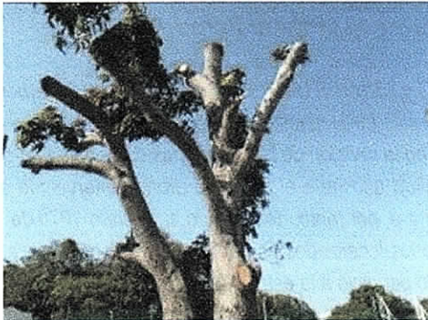
COMFAGUAJIRA – EURERE, Costado Norte Distrito de Riohacha. 04/02/2019