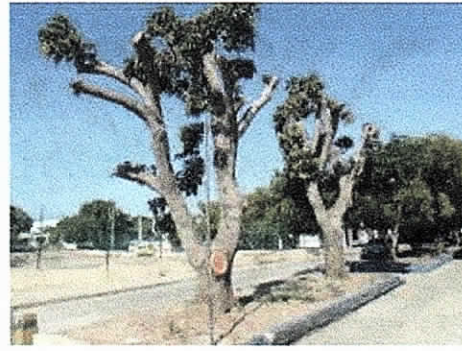
COMFAGUAJIRA – EURERE, Costado Norte Distrito de Riohacha. 04/02/2019