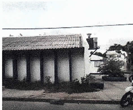
Fotografía 1 Emplazamiento vacío

COMFAGUAJIRA – EURERE, Costado Nororiental Distrito de Riohacha. 04/02/2019