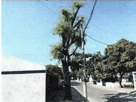
COMFAGUAJIRA – EURERE, Costado Sur Oriental Distrito de Riohacha. 04/02/2019