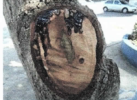
COMFAGUAJIRA – EURERE, Costado Occidental Distrito de Riohacha. 04/02/2019