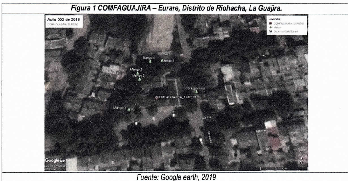
Figura 1 COMFAGUAJIRA – Eurare, Distrito de Riohacha, La Guajira.

El día 04 de febrero de 2019, se realizó la verificación del estado actual del arbolado urbano establecido en los andenes ubicados entre carreras 6d y 6e, entre calles 33 y 33a en el Distrito de Riohacha, se realizó la inspección visual del área indicada en la queja ENT 9112, encontrando un (1) árbol de la especie Platymiscium pinnatum (corazón fino) perteneciente a la familia Leguminosae y cinco (5) árboles de la especie Mangifera indica (mango) perteneciente a la familia Anacardiaceae, (ver Figura 1), se evidencia la tala y destococonado de un (1) individuo de la especie Platymiscium pinnatum (corazón fino), para lo cual se registraron los datos que se presentan en la Tabla 1.