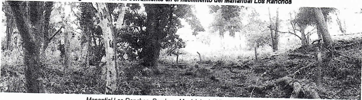
Fotografía 1 Área con cerramiento en el nacimiento del Manantial Los Ranchos

Manantial Los Ranchos, Porciosa, Municipio de Albania 10/04/2019