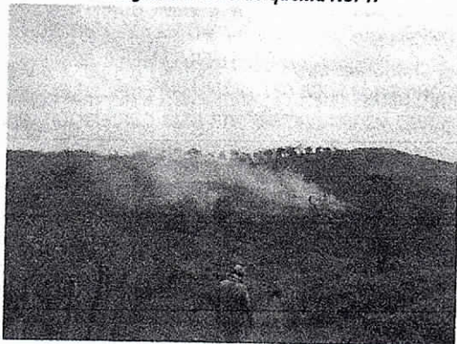
Fotografía 2 Sitio de quema No. 1.

Comunidad Marcel Los Ranchos, Porciosa, Municipio de Albania 10/04/2019