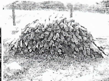
Madera acopiada en el sitio

En sendas fotografías anexas se puede demostrar el producto decomisado.