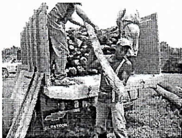
Descargue de madera