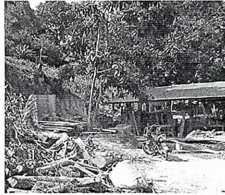
Fotografía 2.7 Árbol de roble

Lote 28, corregimiento de Palomino. Municipio de Dibulla, 14/02/2019