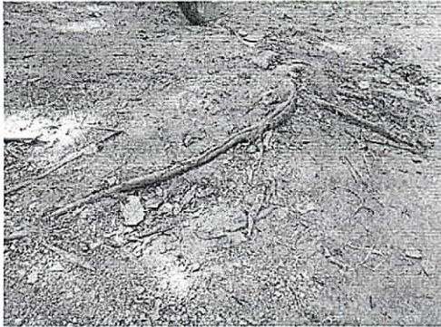
Fotografía 2.6 Raíces de roble

Lote 28, corregimiento de Palomino. Municipio de Dibulla, 14/02/2019