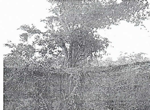
Fotografía 2.5 Raíces expuestas del árbol de higuerón

Lote 28, corregimiento de Palomino. Municipio de Dibulla, 14/02/2019