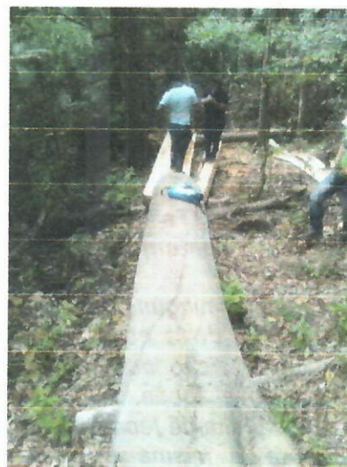
Fig. 3. Punto 1 de transformación