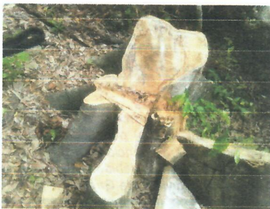
Fig. 2. Tocón individuo de Guáimaro