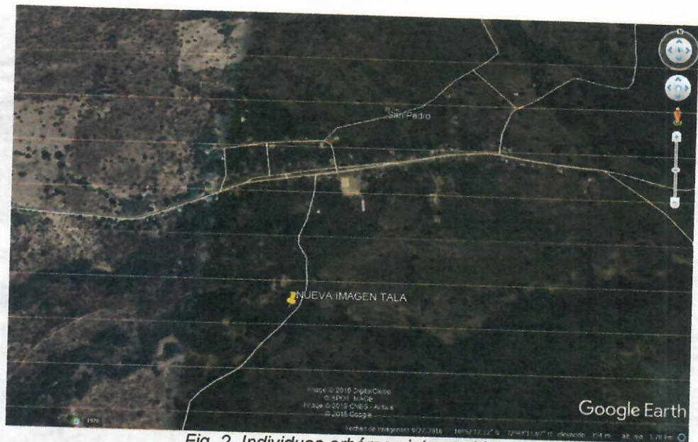
Fig. 2. Individuos arbóreos intervenidos.