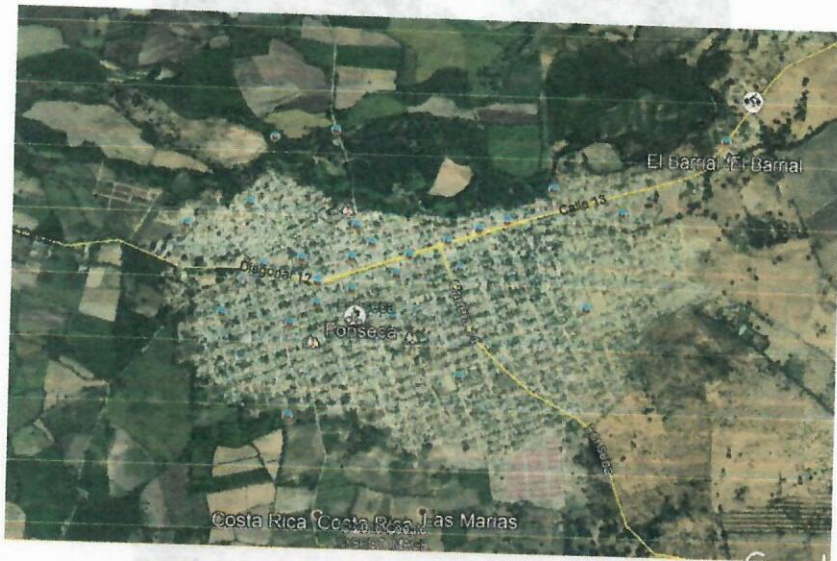
Fig.1. Ubicación satelital de la ruta y zona de interés.