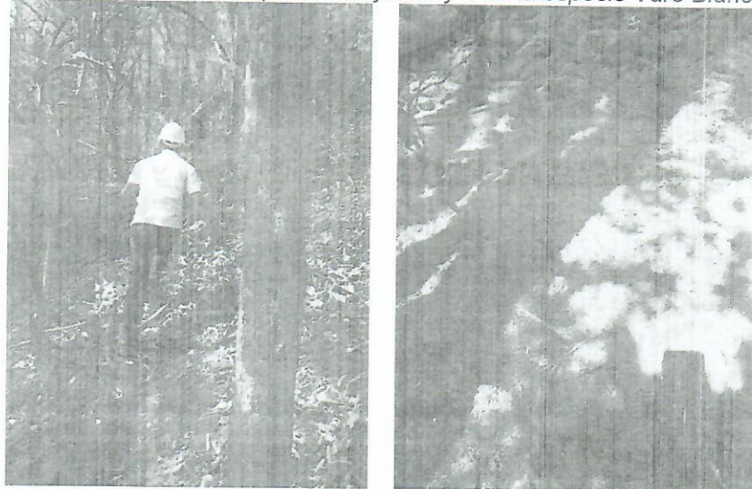
Fig. Recorrido y evidencia de residuos del aprovechamiento