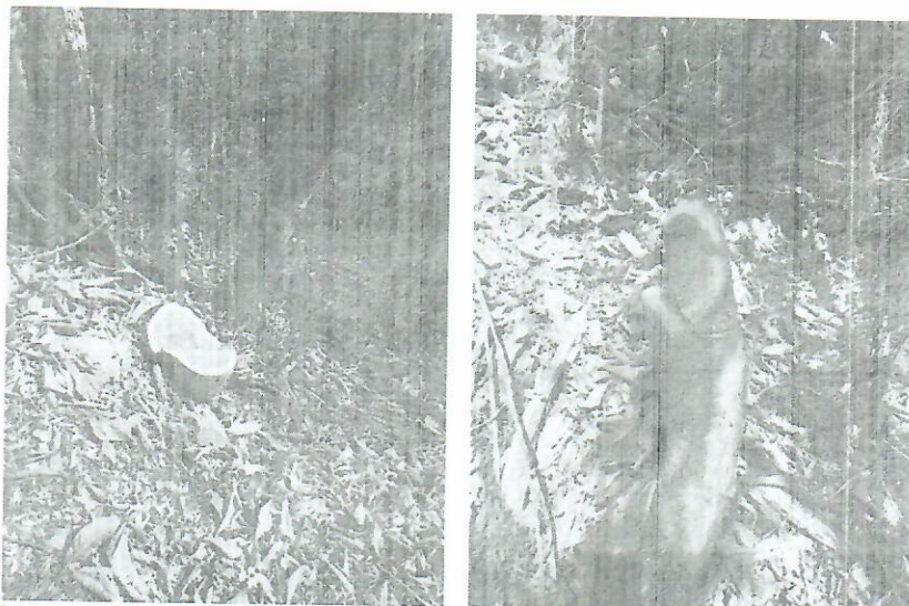
Fig. Individuo 3 de la especie Guayacán y 4 de la especie Varo Blanco