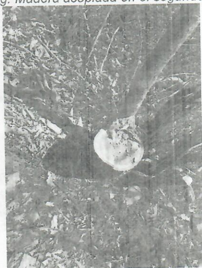
Fig. Dasometría de los tocones 1 y 2 de la especie Guayacán