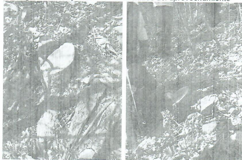
Fig. Individuo arboreo 5 y 6 de la especie Guayacán