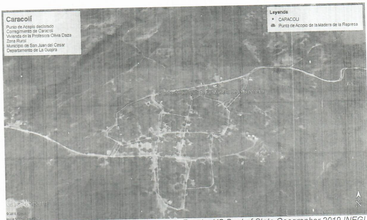
Fig. Punto de acopio de madera de la represa.