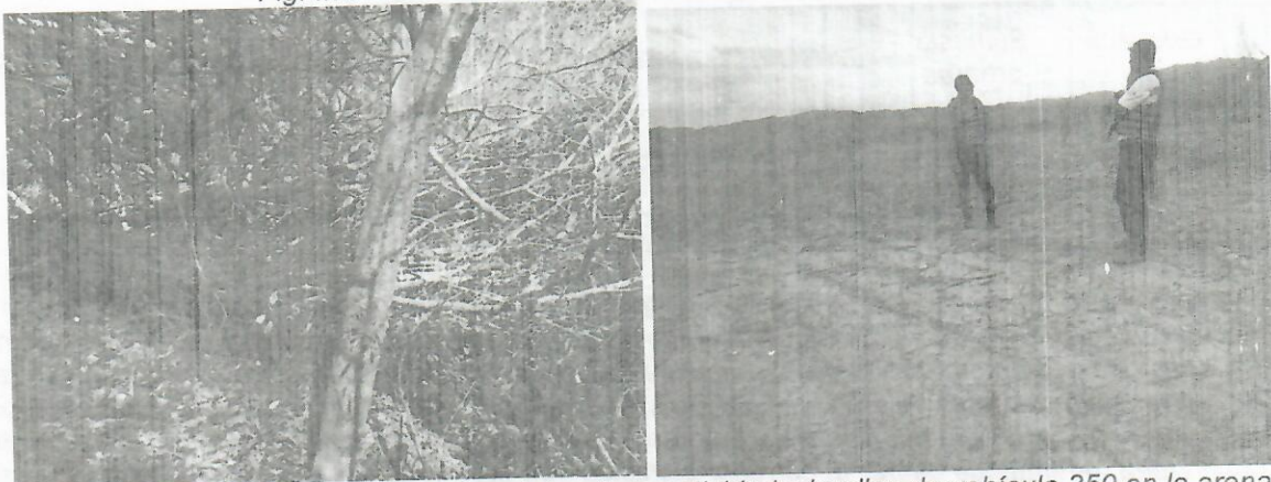
Fig. Evidencia de los residuos forestales de la actividad y huellas de vehículo 350 en la arena