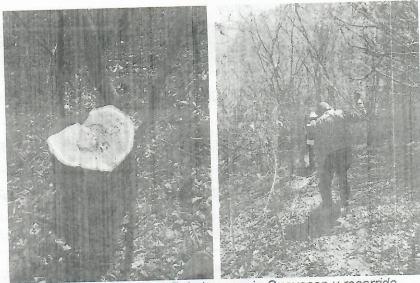
Fig. Individuo arboreo 7 de la especie Guayacán y recorrido.