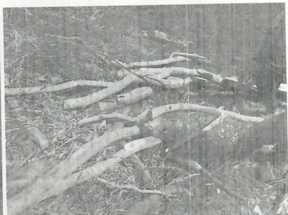
Fig. Canoa en la que transportaban la madera Fig. Madera acopiada en el segundo punto