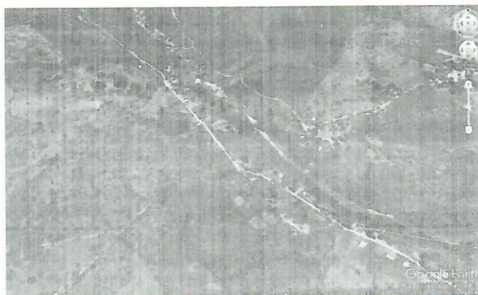
Fig. 2. Ubicación de la tala (predio), Fuente: US Dept of State Geographer 2018 INEGI, 2018 Google