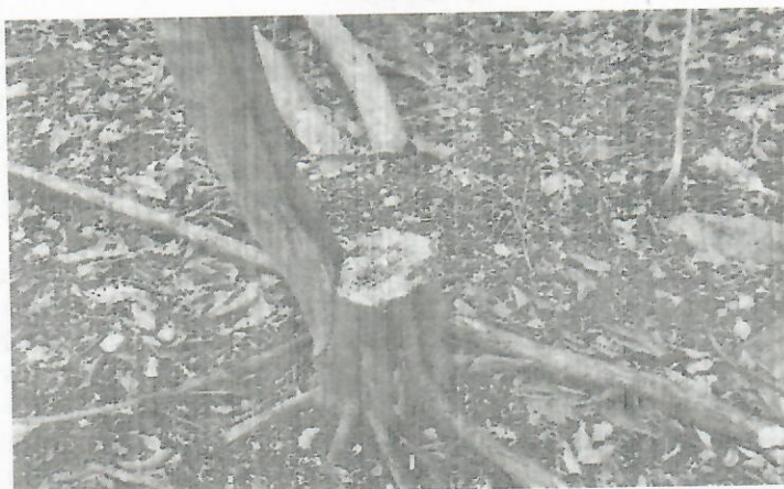
Fig. 6. Fuste de individuo arboreo intervenido