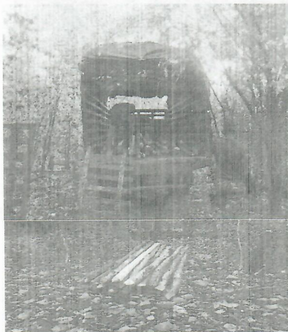
Fig. (1-2). Identificación de la presunta Tala