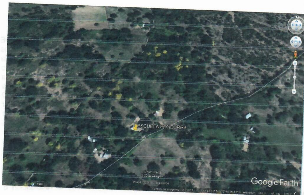
Fig. 2. Sitio tala de árboles.