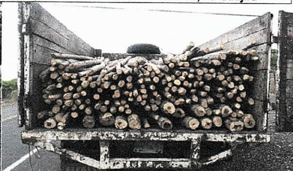
Foto 2. Madera incautada