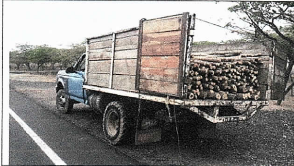
Foto 1. Vehículo