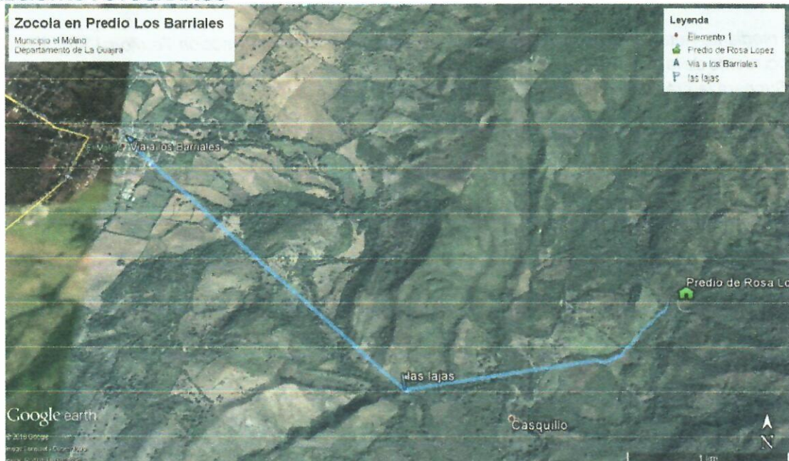
Foto.1. Ruta de desplazamiento al sitio de interés