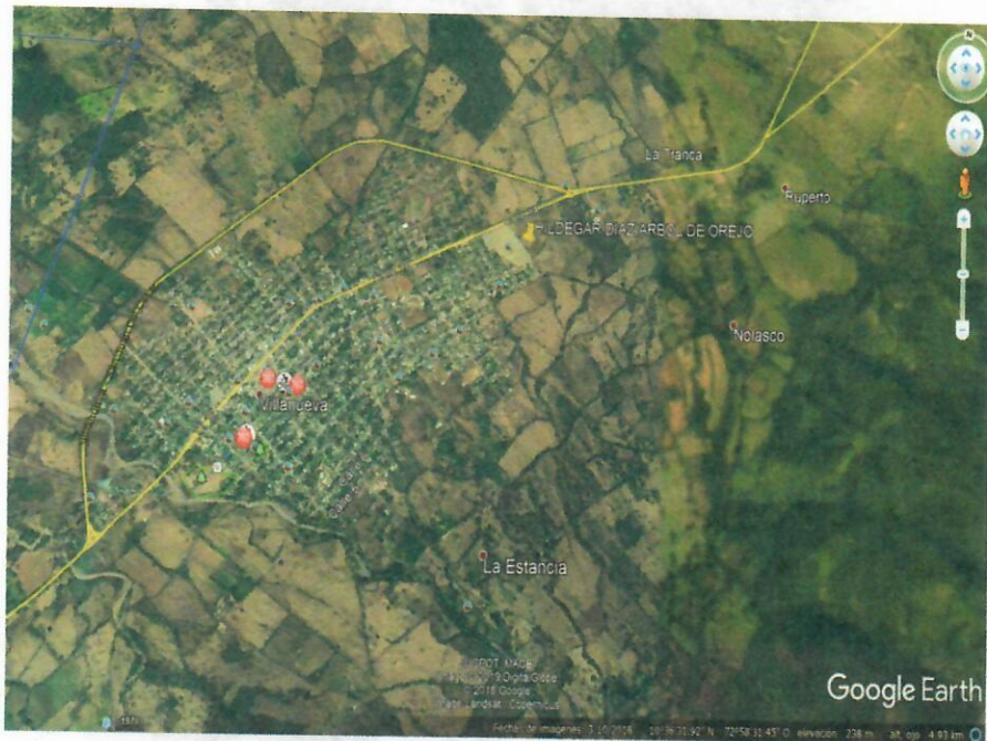
Fig. 1. Ubicación satelital de la ruta y zona de interés.