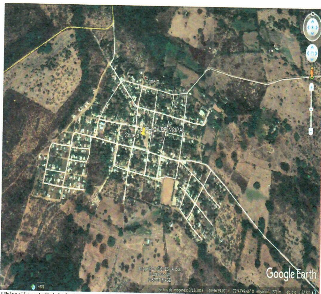
Ubicación satelital de la ruta y zona de interés.